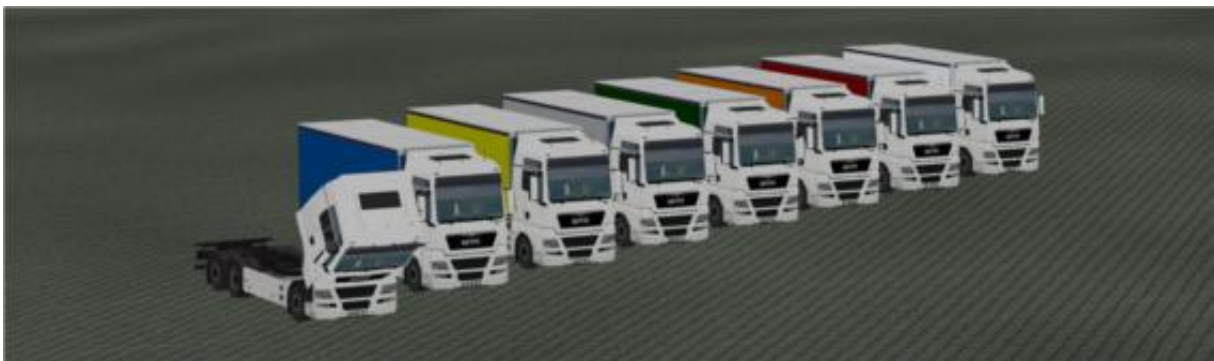
Die LKW in „Weiß“ als Immobilie.