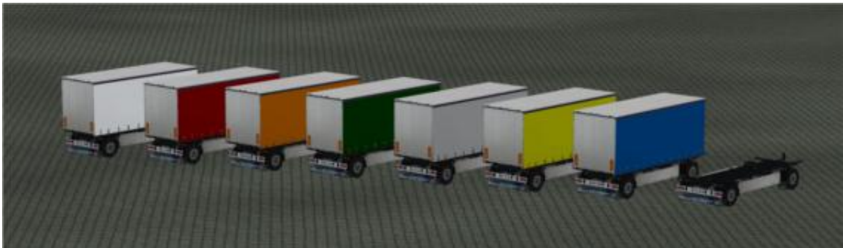
Die Anhänger als Immobilie.