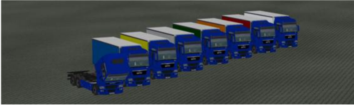
Die LKW in „Blau“ als Immobilie.