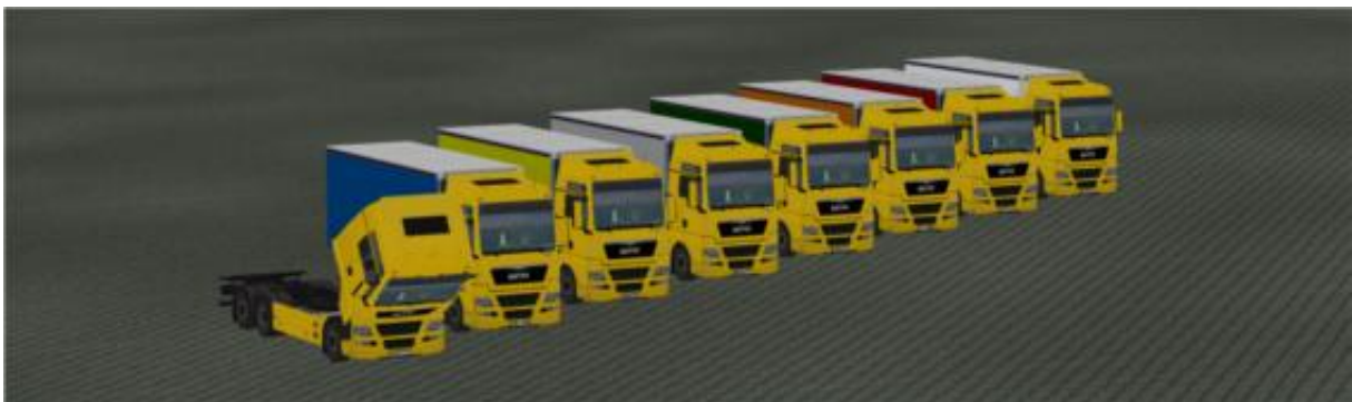
Die LKW in „Gelb“ als Immobilie.