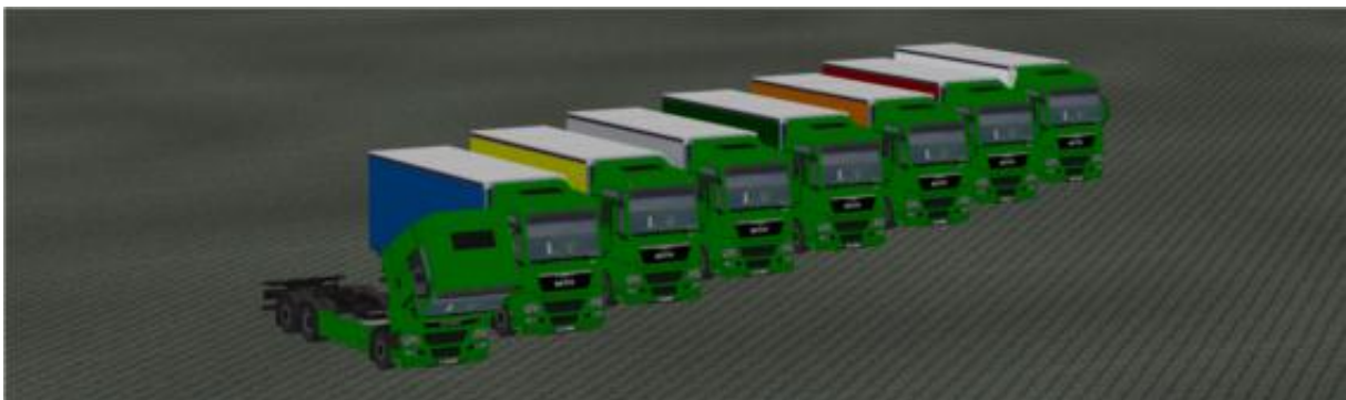
Die LKW in „Grün“ als Immobilie.