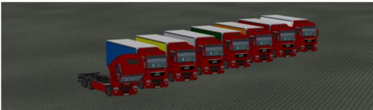
Die LKW in „Rot“ als Immobilie.