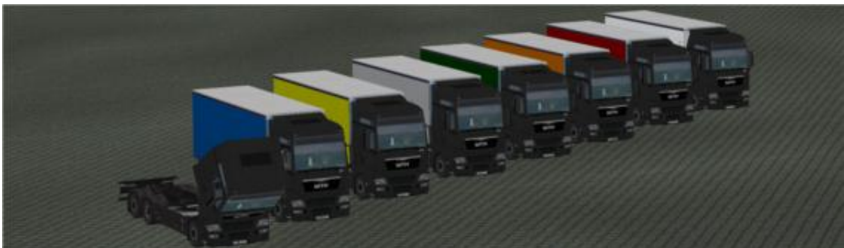
Die LKW in „Anthrazit“ als Immobilie.