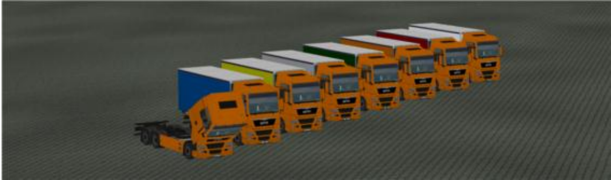
Die LKW in „Orange“ als Immobilie.