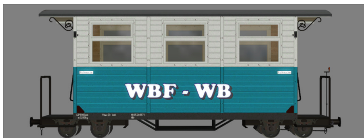
GPW 16 – WEM Privatbahn petrol/weiß (WBF-Waldbahn) – (Modellname: WEM_PBWg_petr_w_KK1 – enthalten in: V11NKK10063)