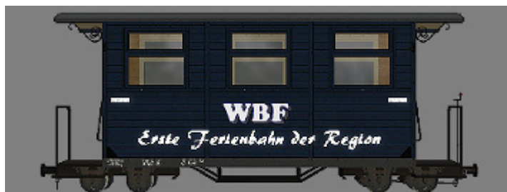
GPW 16 – WEM Privatbahn dunkelblau (WBF-EFdR) – (Modellname: WEM_PBWg_db_KK1 – enthalten in: V11KKK10063)