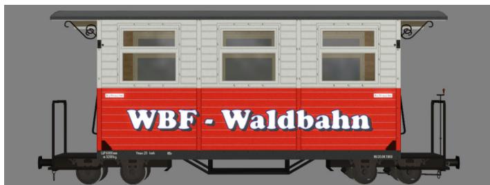
GPW 16 – WEM Privatbahn rot/weiß (WBF-Waldbahn) – (Modellname: WEM_PBWg_rot_w_KK1 – enthalten in: V11NKK10063)