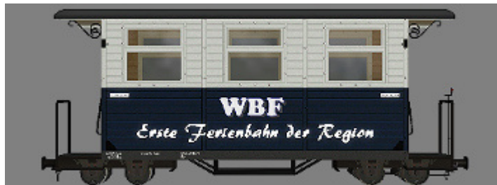
GPW 16 – WEM Privatbahn dunkelblau/weiß (WBF-EFdR) – (Modellname: WEM_PBWg_db_w_KK1 – enthalten in: V11KKK10063)