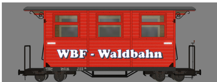
GPW 16 – WEM Privatbahn rot (WBF-Waldbahn) – (Modellname: WEM_PBWg_rot_KK1 – enthalten in: V11NKK10063)

Die Modelle und die Tauschtexturen werden im Verzeichnis ...\ Resourcen \Rollmaterial\ Schiene \Schmalspur600 installiert. Die Tauschtexturen können bei Bedarf ein beliebiges Verzeichnis verschoben werden.