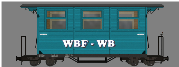
GPW 16 – WEM Privatbahn petrol (WBF-WB) – (Modellname: WEM_PBWg_petrol_KK1 – enthalten in: V11NKK10063)