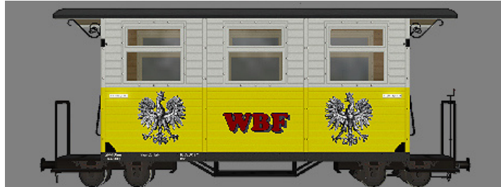
GPW 16 – WEM Privatbahn rot/weiß (WBF-2Wap_rot) – (Modellname: WEM_PBWg_gelb_w_KK1 – enthalten in: V11KKK10063)