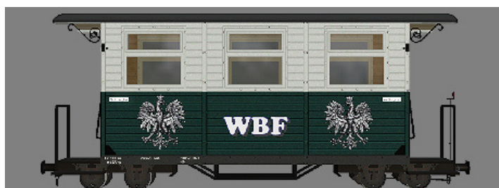
GPW 16 – WEM Privatbahn grün/weiß (WBF-2Wappen) – (Modellname: WEM_PBWg_gruen_w_KK1 – enthalten in: V11KKK10063)