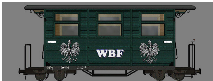
GPW 16 – WEM Privatbahn grün (WBF-2Wappen) – (Modellname: WEM_PBWg_gruen_KK1 – enthalten in: V11KKK10063)