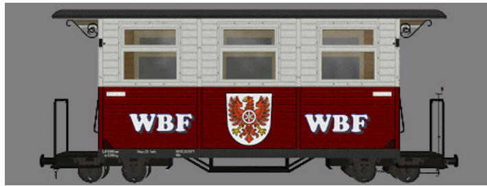
GPW 16 – WEM Privatbahn dunkelrot/weiß (WBF-Wappen) – (Modellname: WEM_PBWg_drot_w_KK1 – enthalten in: V11KKK10063)