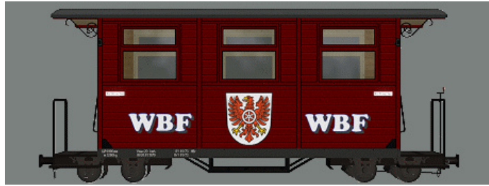
GPW 16 – WEM Privatbahn dunkelrot (WBF-Wappen) – (Modellname: WEM_PBWg_drot_KK1 – enthalten in: V11KKK10063)

Als weitere Farbvarianten gibt es die Wagen nun auch in Dunkelrot, Dunkelgrün, Gelb und Dunkelblau. Die Beschriftung ist wieder als Tauschtextur ausgeführt. Die Varianten der Tauschtexturen werden wieder im gleichen Verzeichnis als PND-Dateien abgelegt, um die Modelle ggf. Wieder herstellen zu können (besser ist es natürlich, mit Clon-Modellen zu arbeiten).