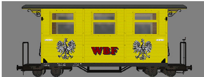
GPW 16 – WEM Privatbahn gelb (WBF-2Wap_rot) – (Modellname: WEM_PBWg_gelb_KK1 – enthalten in: V11KKK10063)