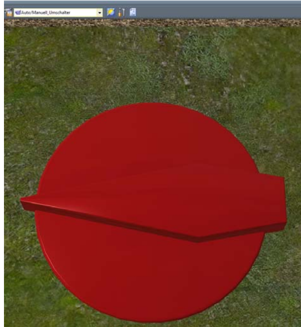
Abb. 1 der Auto/Manuell Schalter (im Bild die Stellung Manuell)

Wird die Anlage gesteuert sobald die beiden Signalschalter für Manuell und Einfahrt aktiv gestellt werden.