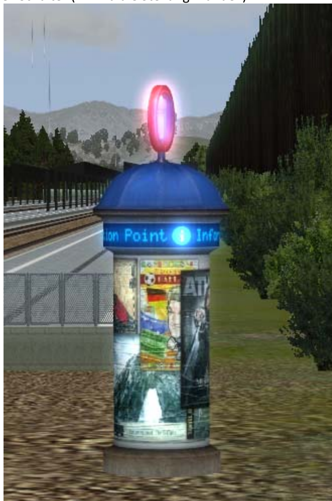
Abb. 2 das Signal zum Ein- und Ausschalten der Einfahrten befindet sich in der Säule

Der Schalter im Bild 1 startet die Automatik (rechts) oder hält die Automatik an (links).