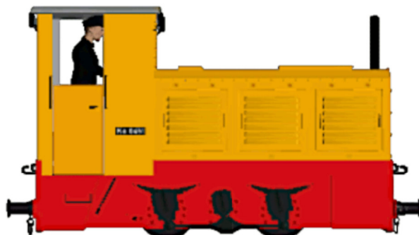
WEM Kö0451 gelb

Dateiname: WEM_Koe0451g_KK1 Fabriknummer: 249 230 Baujahr: 1957 Besonderheiten: Führerstand mit Türen langer Auspuff (vorn rechts) 4 hoch-gesetzte Lampen (in dieser Lackierung war die Lok 2003 unterwegs)