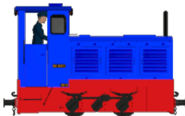
WEM Kö0452 (Farbgebung 2009)

Dateiname: WEM_Koe0452_KK1 Fabriknummer: 249 270 Baujahr: 1960 Besonderheiten: Dachlüfter, Signalhorn Führerstand mit Türen, extra Fenster langer Auspuff (vorn rechts) 4 hoch-gesetzte Lampen, extra Rücklichter geänderte Haken Position