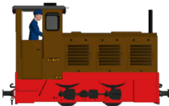
WEM Kö0452 braun (Farbgebung 2017)

Dateiname: WEM_Koe0452_KK1 Fabriknummer: 249 270 Baujahr: 1960 Besonderheiten: wie die blaue Version Signalhorn unterm Dach