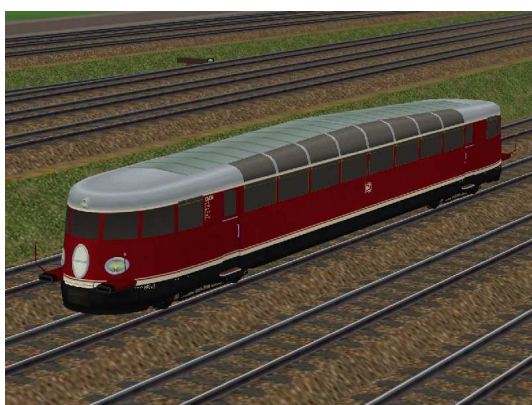
Vogelperspektive VT90 500