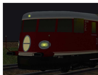
Nachtansichten mit Lichtwechsel