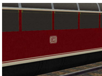
Hoheitszeichen DB von 1956