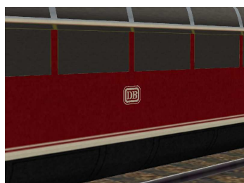
Hoheitszeichen DB von 1956