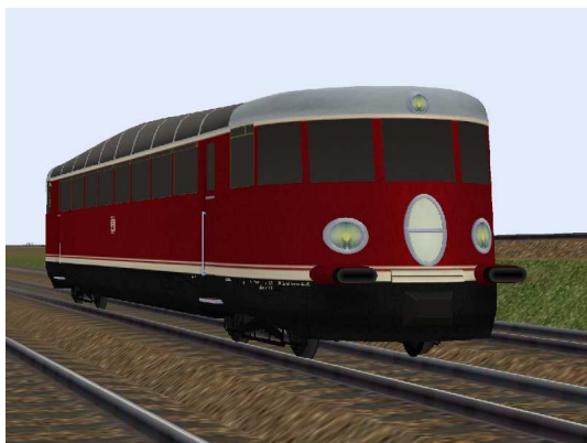
Gesamtansichten VT90 501

Als Besonderheit ist zu nennen, dass die Fahrzeuge über ein großes, zweiteiliges Rollverdeck verfügten, welches bei günstiger Witterung ein ganz besonderes Fahrgefühl vermittelte.