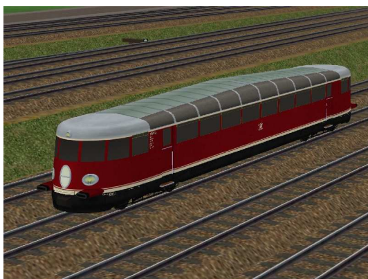
Vogelperspektive VT90 501