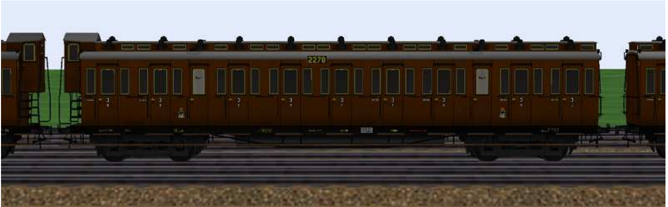
3.Klasse-Wagen mit der Nummer Berlin 2278.

Die Wagen dieser Gattung besitzen (Schwanenhals-) Drehgestelle mit Speichen- oder Scheibenrädern (Radstand 2,15 m), Drehzapfenabstand 12,25 m, sind mit einem Bremserhaus ausgerüstet und besitzen 4 Aborte (WC-Anlagen). Das andere Wagenende ist mit einem Aufstieg aus Einzelstufen ausgerüstet. Die Modelle sind beleuchtet, die Kupplung sind funktionsfähig nachgebildet. Ausgerüstet mit Potsdamer Luftsaugern und haben versenkbare Schlusscheiben. Farbgestaltung und Bezeichnung sind dem Original nachempfunden, die Wagennummern sind aus dem am Vorbild orientierten Nummernschema frei gewählt.