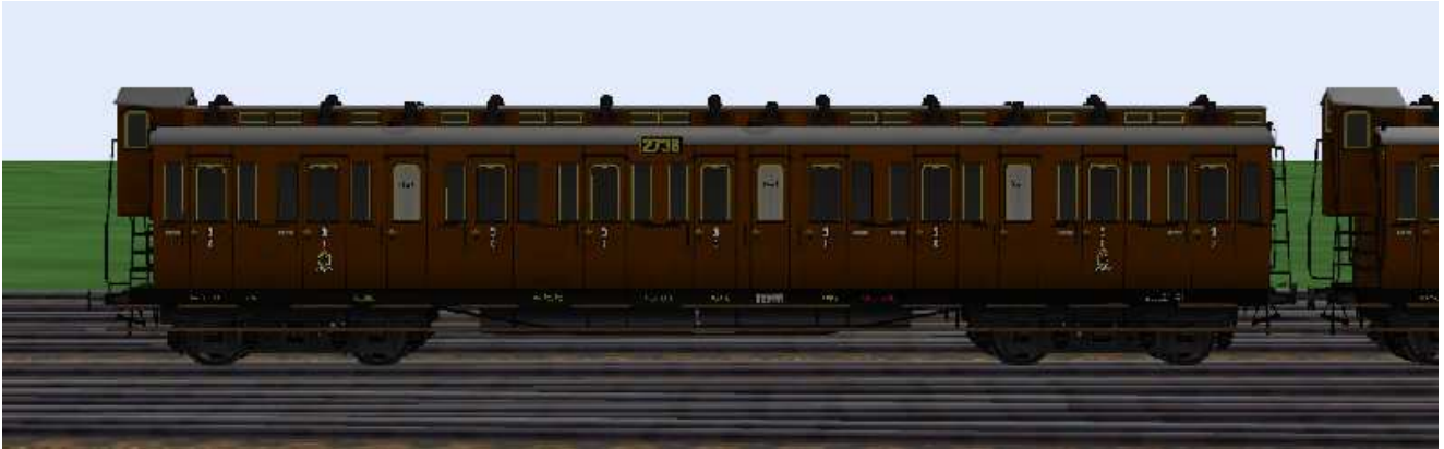
3.Klasse-Wagen mit der Nummer Berlin 2736.

Die Wagen dieser Gattung besitzen (Schwanenhals-) Drehgestelle mit Speichenrädern (Radstand 2,5 m), Drehzapfenabstand 12,25 m, sind mit einem Bremserhaus ausgerüstet und besitzen 5 Aborte (WC-Anlagen). Das andere Wagenende ist mit einem Leiternaufstieg ausgerüstet. Die Modelle sind beleuchtet, die Kupplung sind funktionsfähig nachgebildet. Ausgerüstet mit Potsdamer Luftsaugern und haben versenkbare Schlusscheiben. Farbgestaltung und Bezeichnung sind dem Original nachempfunden, die Wagennummern sind aus dem am Vorbild orientierten Nummernschema frei gewählt.