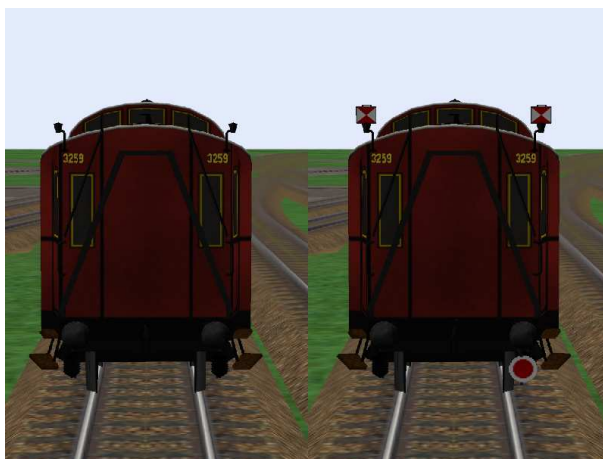
Wagende mit und ohne Schlusscheiben.

zusätzlich Bonusmodelle: Pw4 pr04, Berlin 3036 und Berlin 3137