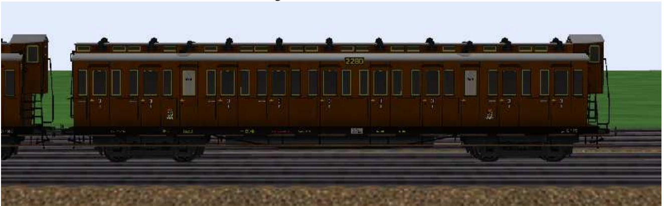
3.Klasse-Wagen mit der Nummer Berlin 2280.