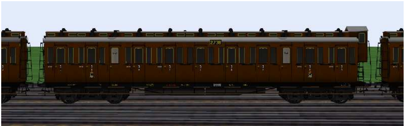
3.Klasse-Wagen mit der Nummer Berlin 2738.