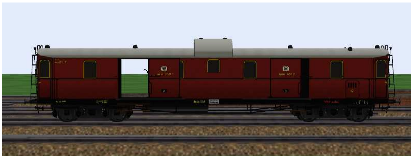
Eilzug-Gepäckwagen mit der Nummer Berlin 3259.