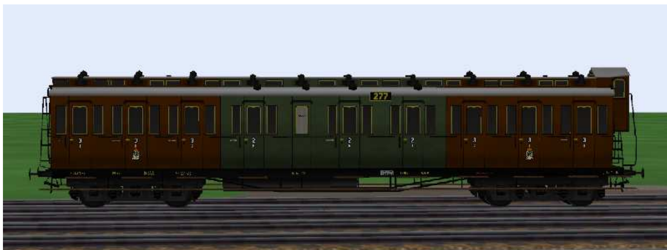
2./3.Klasse-Wagen mit der Nummer Berlin 277.