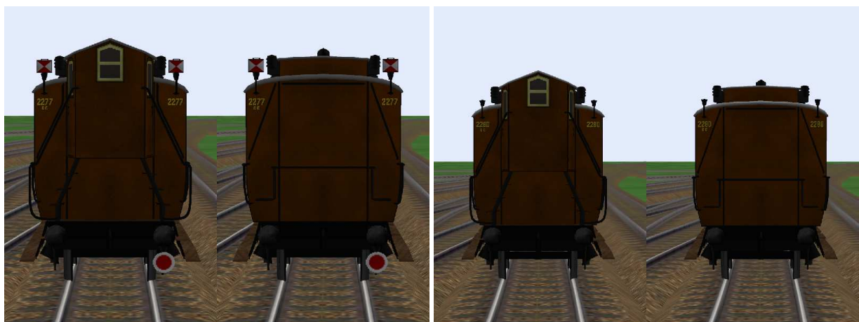
Wagenende mit und ohne Schlusscheiben.

zusätzlich Bonusmodelle: C4 pr12, Berlin 2277 und Berlin 2279