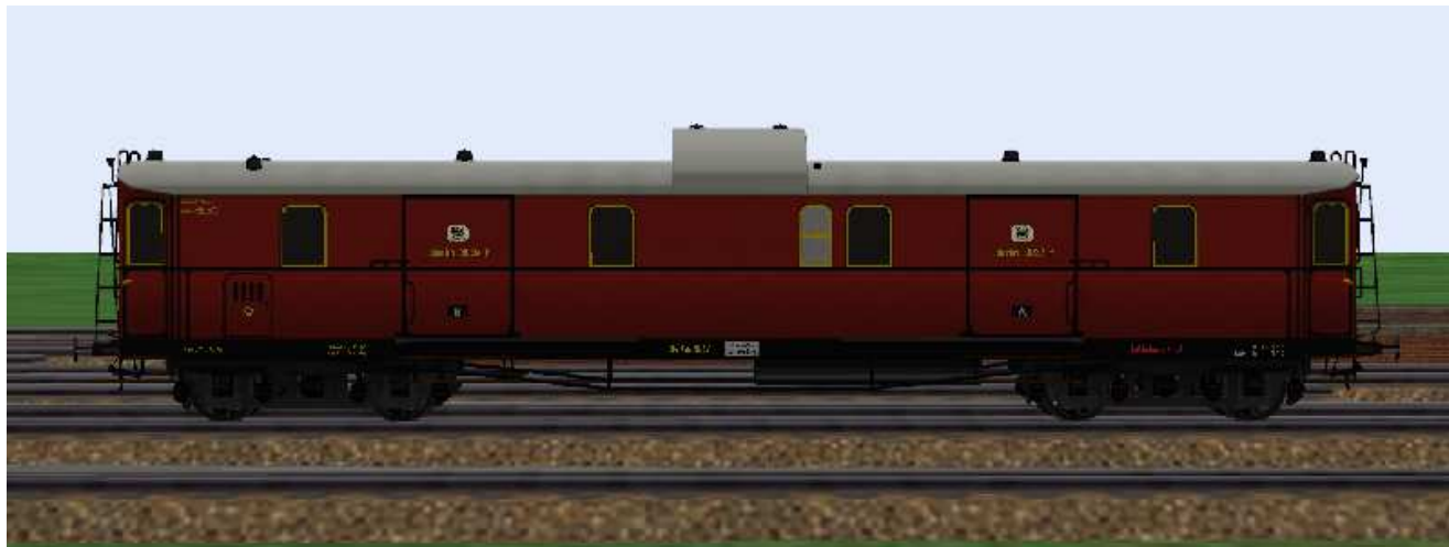
Eilzug-Gepäckwagen mit der Nummer Berlin 3037.

Die Wagen dieser Gattung besitzen (Schwanenhals-) Drehgestelle mit Speichenrädern (Radstand 2,5 m), Drehzapfenabstand 12,0 m, sind an beiden Wagenenden ist mit einem Leiternaufstieg ausgerüstet. Die Modelle sind beleuchtet, die Kupplung sind funktionsfähig nachgebildet und die Türen lassen sich öffnen. Die Modelle sind beleuchtet, die Kupplung sind funktionsfähig nachgebildet und die Türen lassen sich öffnen. Farbgestaltung und Bezeichnung sind dem Original nachempfunden, die Wagennummern sind aus dem am Vorbild orientierten Nummernschema frei gewählt.