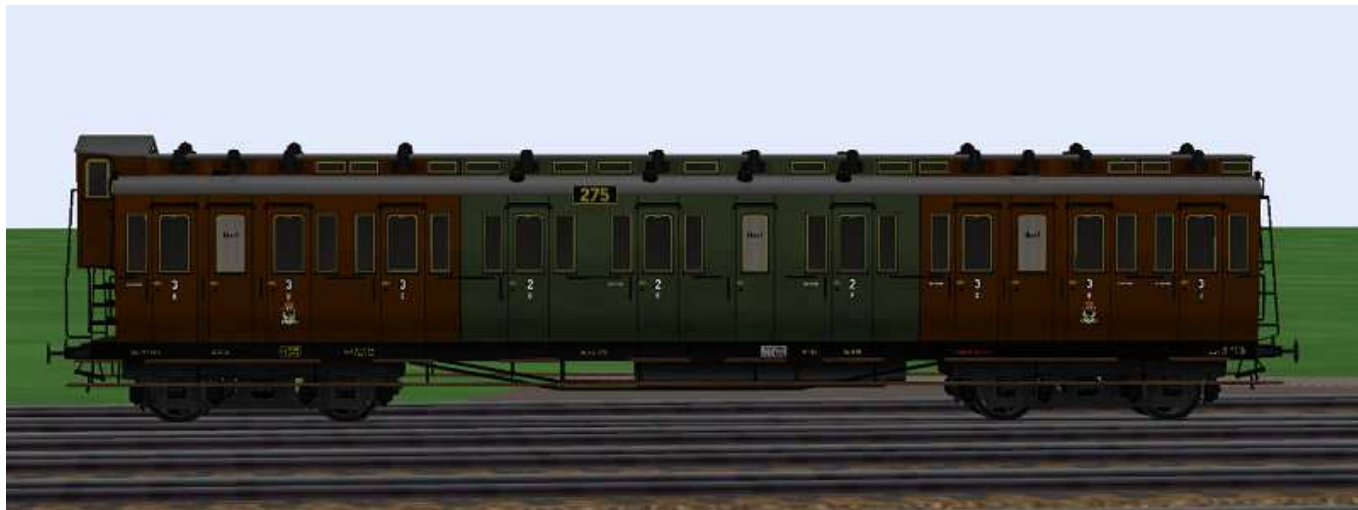
2./3.Klasse-Wagen mit der Nummer Berlin 275.

Die Wagen dieser Gattung besitzen (Schwanenhals-) Drehgestelle mit Speichenrädern (Radstand 2,5 m), Drehzapfenabstand 12,25 m, sind mit einem Bremserhaus ausgerüstet und besitzen 5 Aborte (WC-Anlagen). Das andere Wagenende ist mit einem Leiternaufstieg ausgerüstet. Die Modelle sind beleuchtet, die Kupplung sind funktionsfähig nachgebildet. Ausgerüstet mit Potsdamer Luftsaugern und haben versenkbare Schlusscheiben. Farbgestaltung und Bezeichnung sind dem Original nachempfunden, die Wagennummern sind aus dem am Vorbild orientierten Nummernschema frei gewählt.