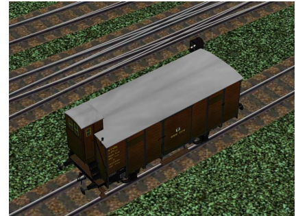
Güterwagen Berlin 9278 von oben rechts