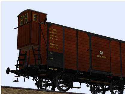
Güterwagen Cöln 9928 Detail Aufstiegsseite