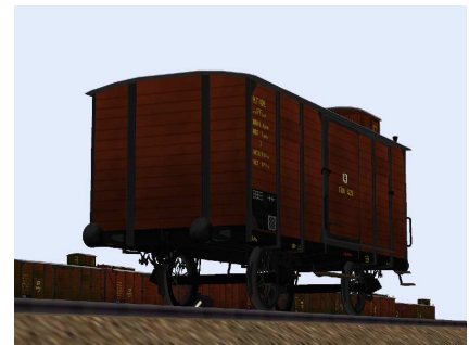
Güterwagen Cöln 9228 von unten links