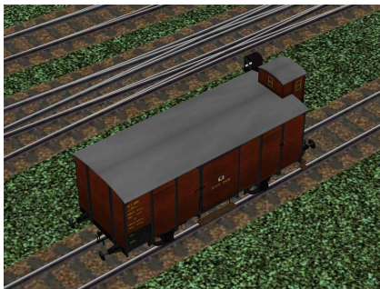
Güterwagen Berlin 9438 von oben links