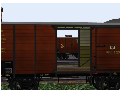
Güterwagen Halle 9524 Detail Tür Durchsicht