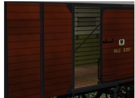
Güterwagen Halle 9397 Detail Tür und innen