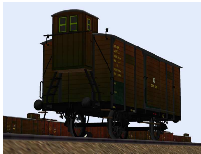
Güterwagen Cöln 9060 von unten rechts