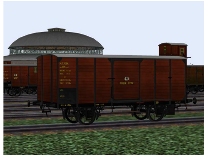
Güterwagen Berlin 9202 von der linken Seite