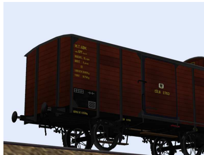
Güterwagen Cöln 9763 Detail ohne Aufstieg