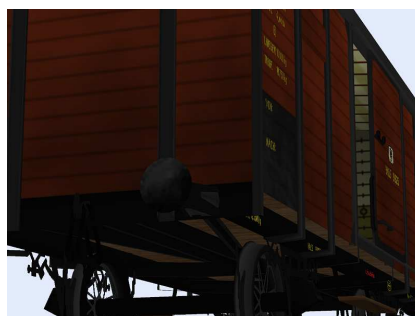
Güterwagen Halle 9825 Detail Untergestell von links