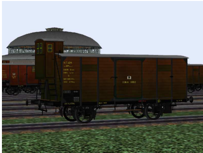
Güterwagen Berlin 9002 von der rechten Seite

Für die Seitenwände gibt es 4 Farbvarianten und für die Dachpartie gibt es 6 Farbabstufungen, dadurch ergibt sich bei Einsatz mehrerer Wagen ein sehr abwechslungsreiches Bild.