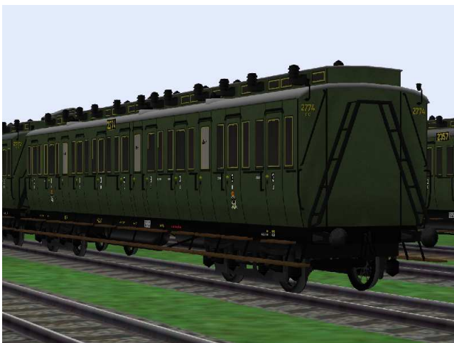
3.Klasse-Wagen mit der Nummer Berlin 2774