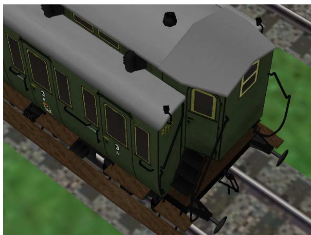
Detail vom Wagenende