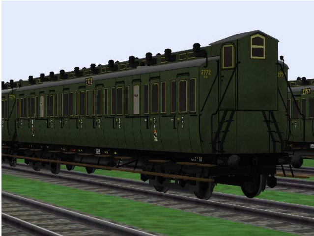
3.Klasse-Wagen mit der Nummer Berlin 2772

Die Wagen dieser Gattung besitzen (Schwanenhals-) Drehgestelle mit Speichenrädern (Radstand 2,5 m), Drehzapfenabstand 12,25 m, sind mit einem Bremserhaus ausgerüstet und besitzen 5 Aborte (WC-Anlagen). Das andere Wagenende ist mit einem Leiternaufstieg ausgerüstet. Die Modelle sind beleuchtet, die Kupplung sind funktionsfähig nachgebildet. Ausgerüstet mit Potsdamer Luftsaugern und haben versenkbare Schlusscheiben. Farbgestaltung und Bezeichnung sind dem Original nachempfunden, die Wagennummern sind aus dem am Vorbild orientierten Nummernschema frei gewählt.