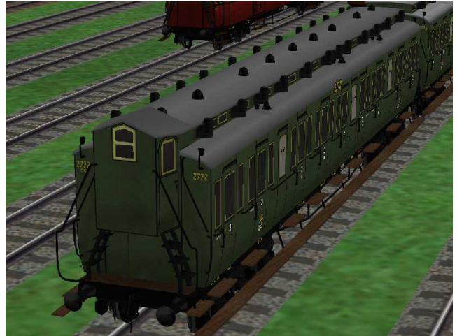
Ansicht von der anderen Seite