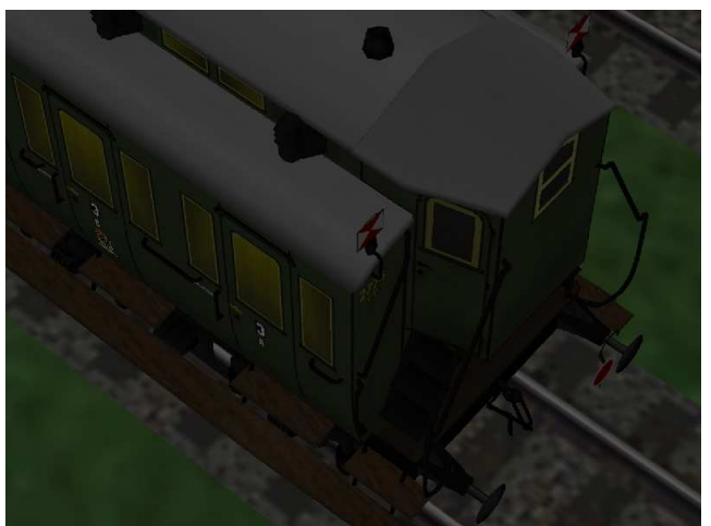
mit Schlusscheiben bei Dunkelheit