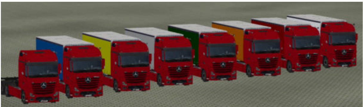
Die LKW in „Rot“ als Immobilie.