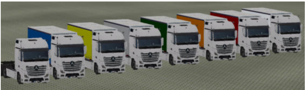
Die LKW in „Weiß“ als Immobilie.