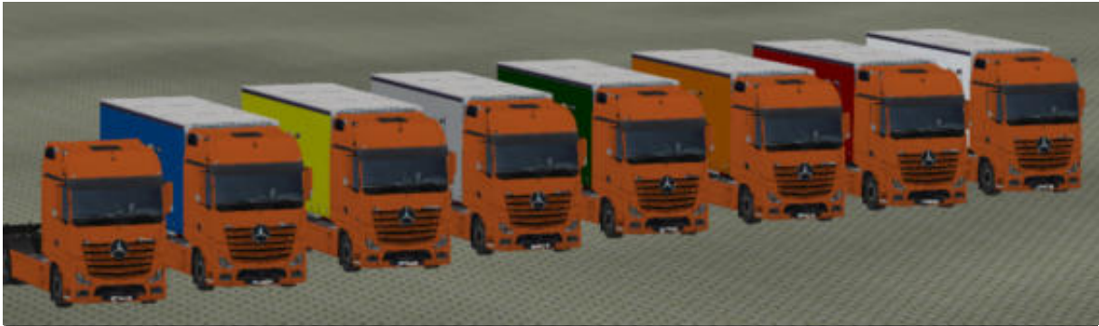
Die LKW in „Orange“ als Immobilie.