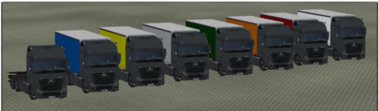
Die LKW in „Anthrazit“ als Immobilie.