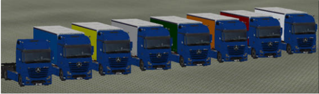
Die LKW in „Blau“ als Immobilie.