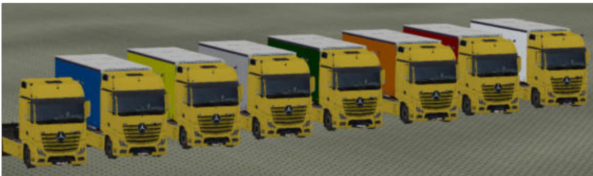
Die LKW in „Gelb“ als Immobilie.