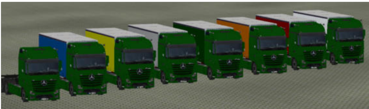
Die LKW in „Grün“ als Immobilie.