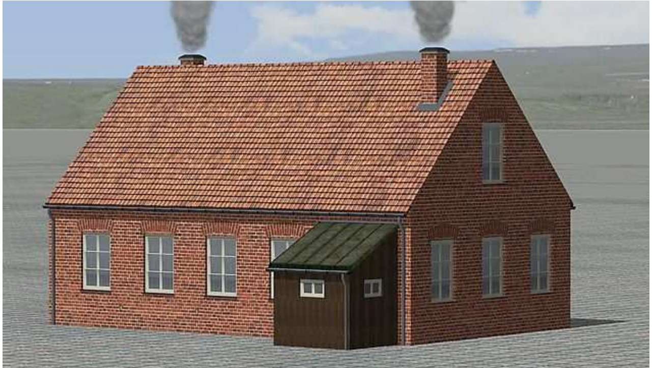
Immobilie BH_Poeppendorf_LBE_AF1 , Beamtenwohnhaus, Bahnsteigseite; 92 qm Grundfläche; Vollprofilfensterahmen; 7,24 m Firsthöhe; Licht- und Rauchfunktion

Die nachstehend aufgeführte Stückliste enthält deshalb neben der Abbildung die Codierung , d.h. den Namen, mit dem Sie das Modell in EEP wieder finden und eine kurze Mo-