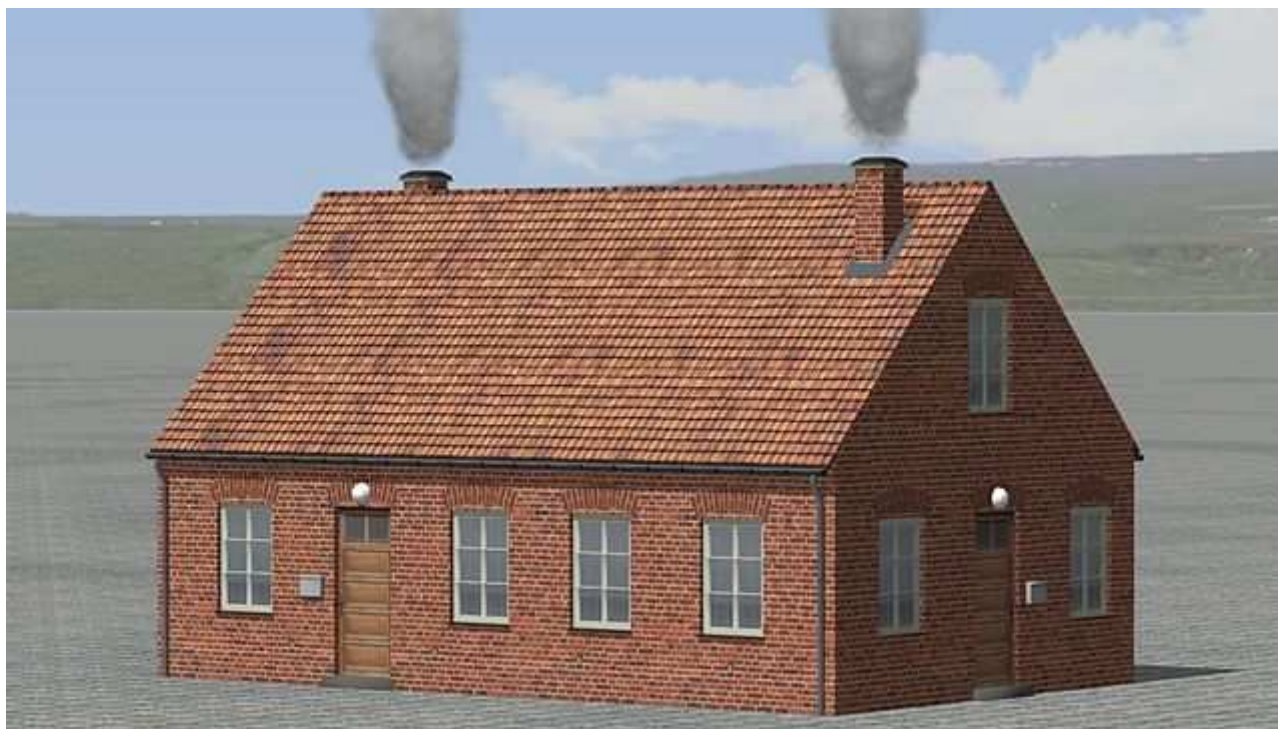
Immobilie BH_Poeppendorf_LBE_AF1 , Beamtenwohnhaus, Rückseite