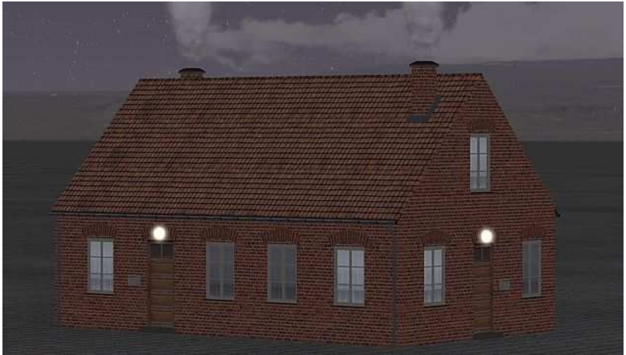
Immobilie BH_Poeppendorf_LBE_AF1 , Beamtenwohnhaus, Rückseite (Nachtansicht)