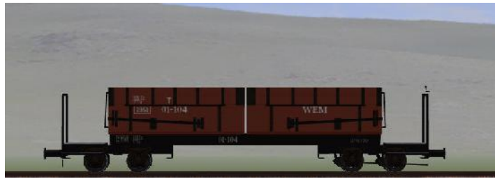
Umbau nach 1950 (WEM) – 01-104 – (WEM – Rahmen geschweißt – braune Sitzbänke) (Modellname: WEM_Personenwagen_01_104 – enthalten in: V70NKK10)