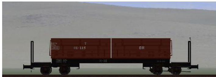
Umbau nach 1950 (WEM) – 01-115 – (DR – Rahmen genietet – braune Sitzbänke) (Modellname: WEM_Personenwagen_01_115 – enthalten in: V70NKK10)