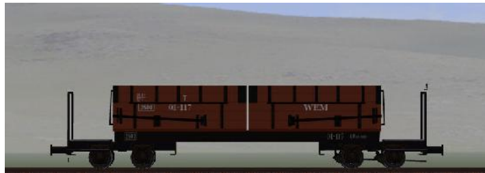
Umbau nach 1950 (WEM) – 01-117 – (WEM – Rahmen genietet – braune Sitzbänke) (Modellname: WEM_Personenwagen_01_117 – enthalten in: V70NKK10)