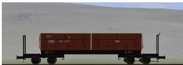
Umbau nach 1950 (WEM) – 01-097 – (DR – Rahmen genietet – braune Sitzbänke) (Modellname: WEM_Personenwagen_01_097 – enthalten in: V70NKK10)