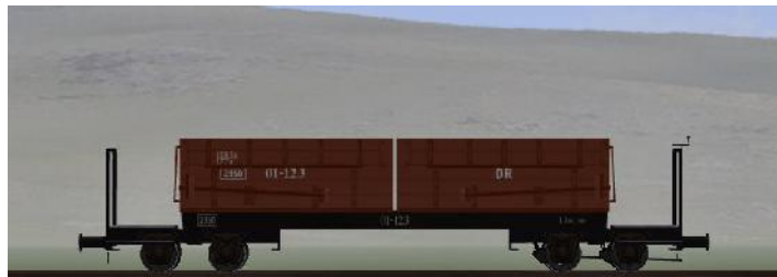
Umbau nach 1950 (WEM) – 01-123 – (DR – Rahmen genietet – braune Sitzbänke) (Modellname: WEM_Personenwagen_01_123 – enthalten in: V70NKK10)