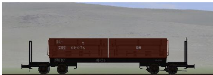
Umbau nach 1950 (WEM) – 01-076 – (DR – Rahmen genietet – graue Sitzbänke) (Modellname: WEM_Personenwagen_01_076 – enthalten in: V70NKK10)