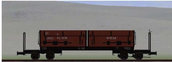
Umbau nach 1950 (WEM) – 01-108 – (WEM – Rahmen geschweißt – graue Sitzbänke) (Modellname: WEM_Personenwagen_01_108 – enthalten in: V70NKK10)