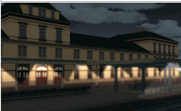
Nachtsansicht von der Gleisseite.