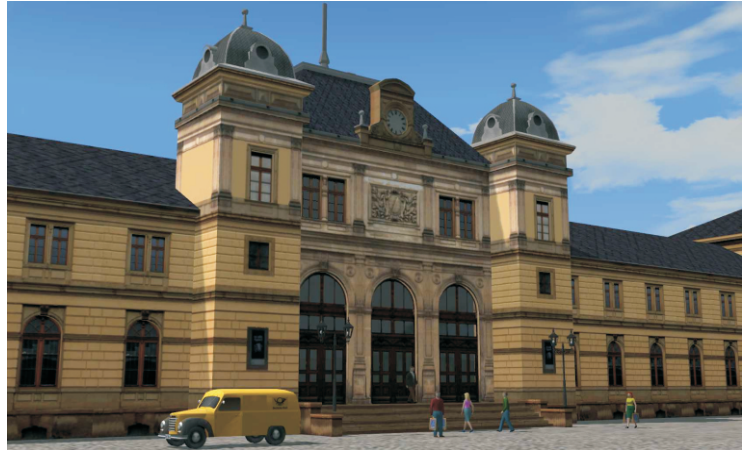
Imposant, der Eingangsbereich des Bahnhof Altenburg.

Altenburg, Skatstadt und ehemalige Residenzstadt gehört politisch zum Bundesland Thüringen. Das Empfangsgebäude wurde 1878 als repräsentativer Ersatzneubau für einen ehemaligen Kopfbahnhof errichtet. Altenburg wird heute nur noch von Regionalexpresszügen in der Relation Leipzig- Hof angefahren. Ehemalige Zweigstrecken nach Zeitz und Langenleuba-Oberhain wurden stillgelegt. Entgegen des allgemeinen Abrisstrend wurde das Empfangsgebäude denkmalgerecht saniert.