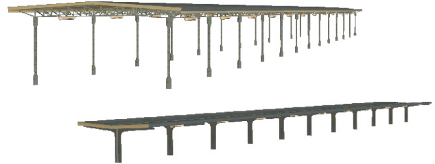
Bahnsteigüberdachungen als Immobilien.