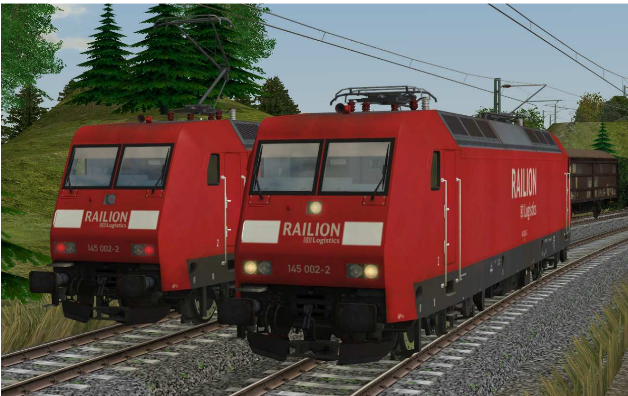
Beleuchtung: 2-Licht-Zugschluß- (links) und 3-Licht-Spitzensignal (rechts)

Die Beleuchtung wechselt fahrtrichtungsabhängig von Dreilichtspitzensignal auf 2-Licht-Zugschlußsignal. Auf der gekuppelten Seite ist das Licht ausgeschaltet.