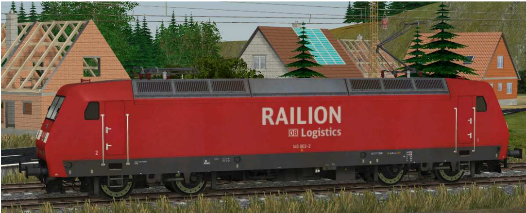
Stromabnehmer: Stromabnehmer 1 angehoben, Stromabnehmer 2 gesenkt

Die Achsenbezeichnungen lauten „Stromabnehmer1-[Loknummer]“ für den vorderen und „Stromabnehmer2-[Loknummer]“ für den hinteren Stromabnehmer.