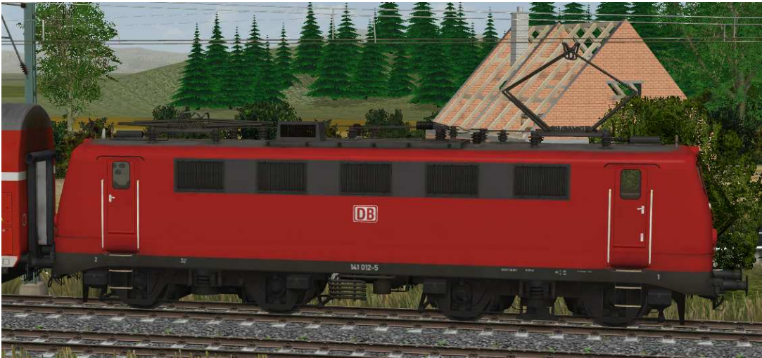
Stromabnehmer: Stromabnehmer 1 angehoben, Stromabnehmer 2 gesenkt

Die Achsenbezeichnungen lauten „Stromabnehmer1-[Loknummer]“ für den vorderen und „Stromabnehmer2-[Loknummer]“ für den hinteren Stromabnehmer.