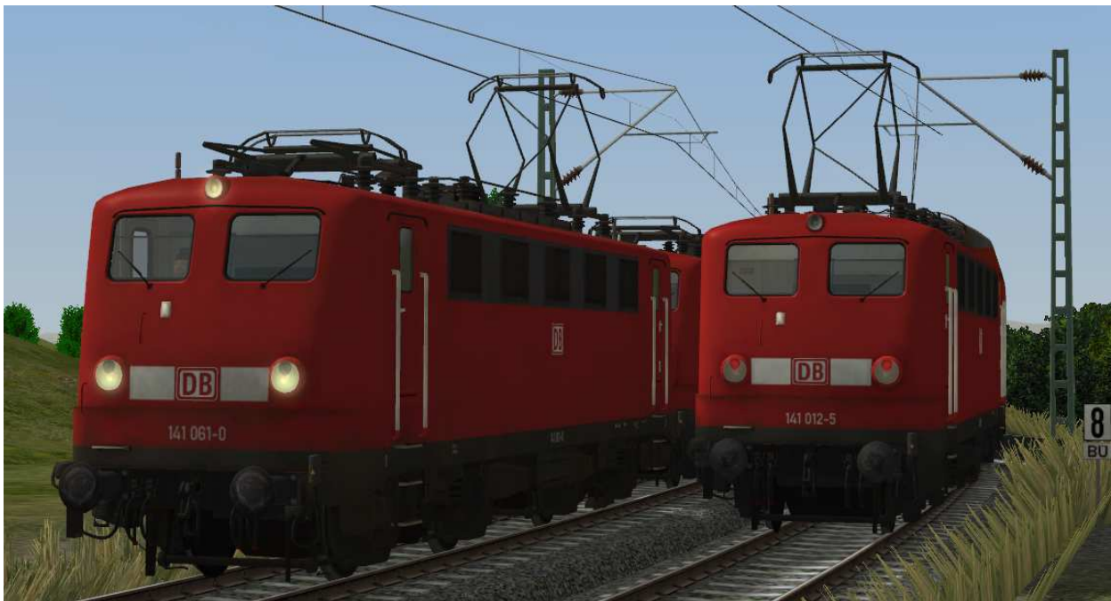
Beleuchtung: 2-Licht-Zugschluß- (rechts) und 3-Licht-Spitzensignal (links)

Die Beleuchtung wechselt fahrtrichtungsabhängig von Dreilichtspitzensignal auf 2-Licht-Zugschlußsignal. Auf der gekuppelten Seite ist das Licht ausgeschaltet.