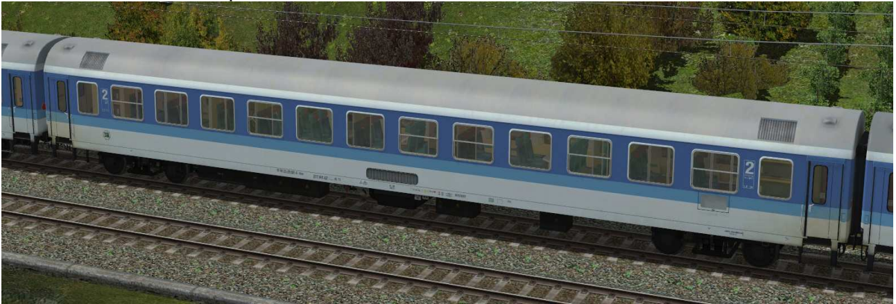
IR-Wagen zweite Klasse – mit offenen WC-System und Einspannungseinrichtung, Ausrüstung für Schnellfahrstrecken