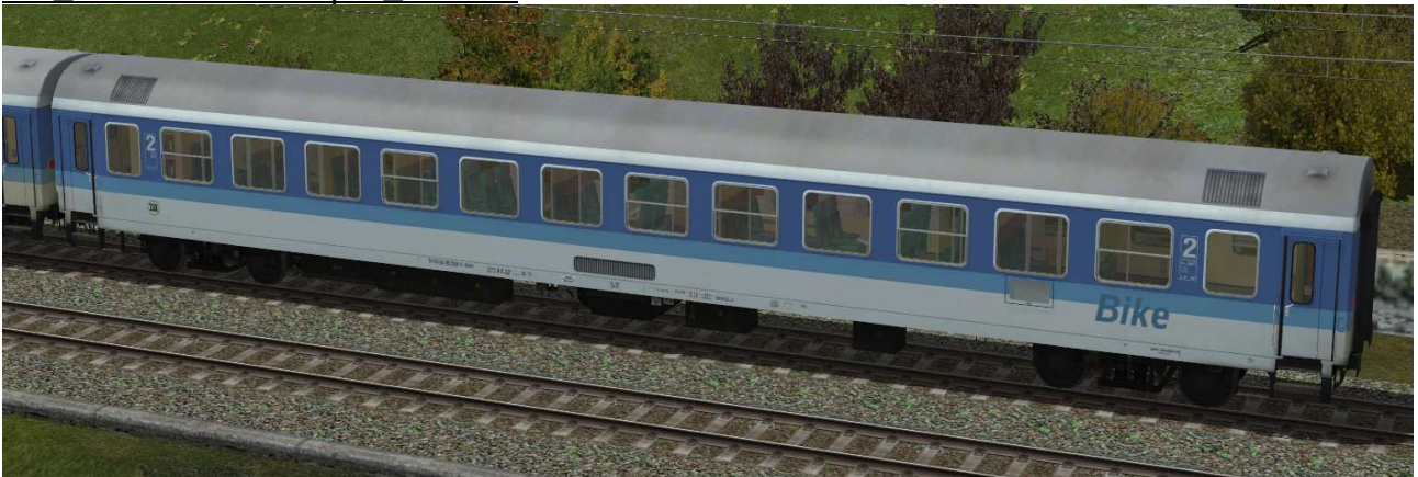
IR-Wagen zweite Klasse mit Fahrradabteil – mit offenen WC-System und Einspannungseinrichtung