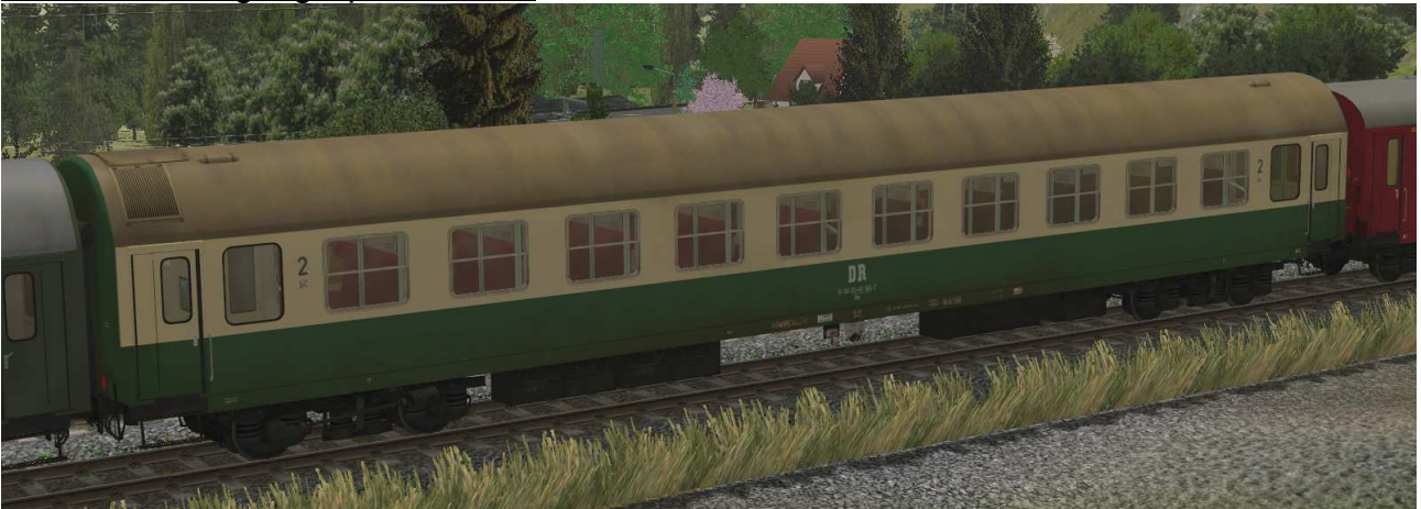
Abteilwagen 2.Klasse Typ Y der DR, Gattung Bme2041, grün-beige Lackierung, modernisiert