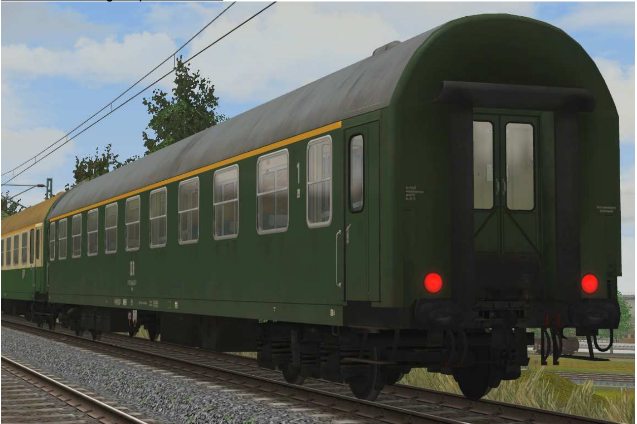
Abteilwagen 1.Klasse Typ Y der DR, Gattung Ame1941, grüne Lackierung - EpIV