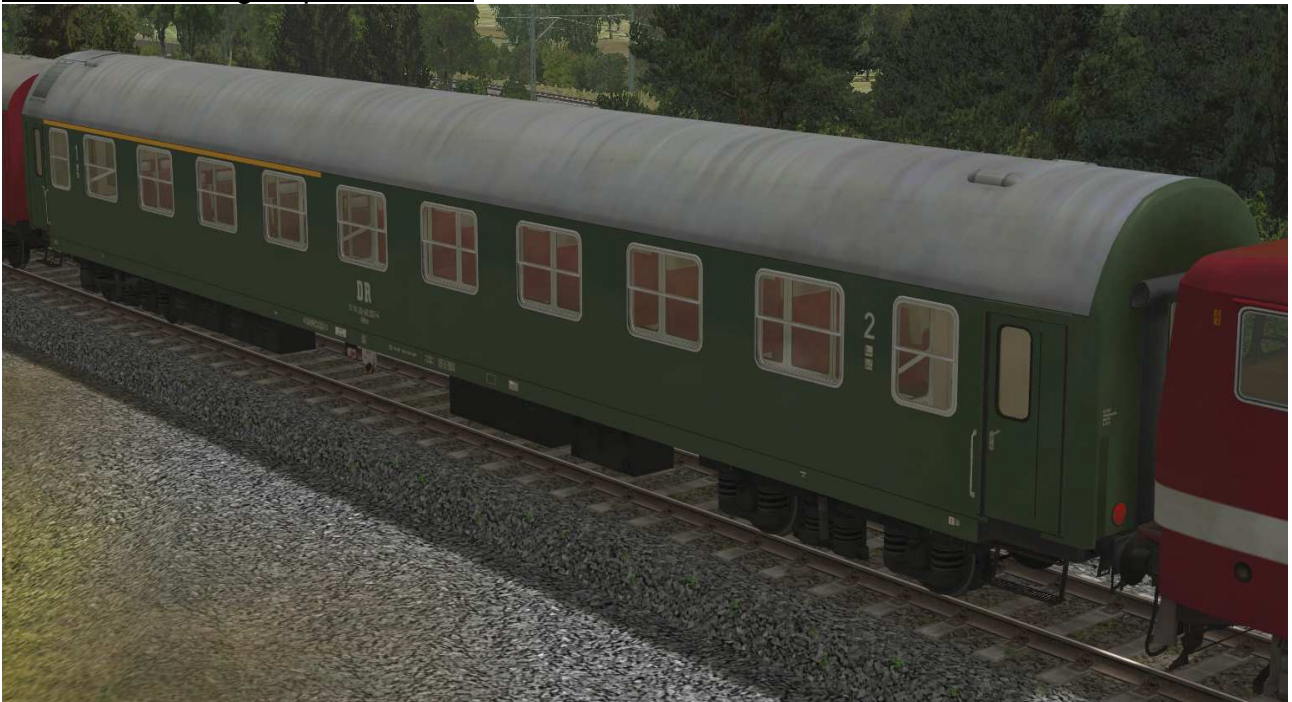
Abteilwagen 1./2.Klasse Typ Y der DR, Gattung ABme3941, grüne Lackierung - EpIV