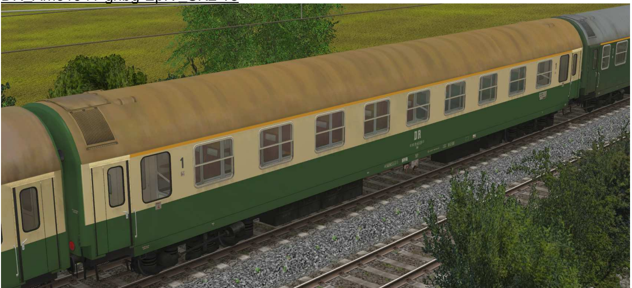
Abteilwagen 1.Klasse Typ Y der DR, Gattung Ame1941, grün-beige Lackierung, modernisiert