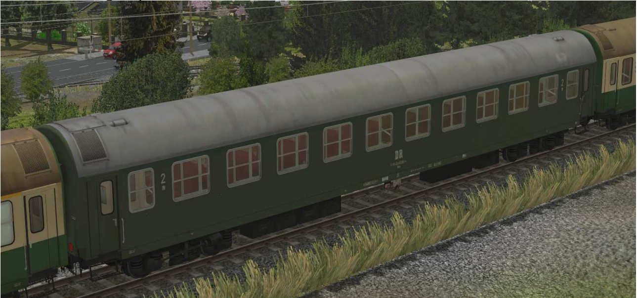
Abteilwagen 2.Klasse Typ Y der DR, Gattung Bme2041, grüne Lackierung - EpIV