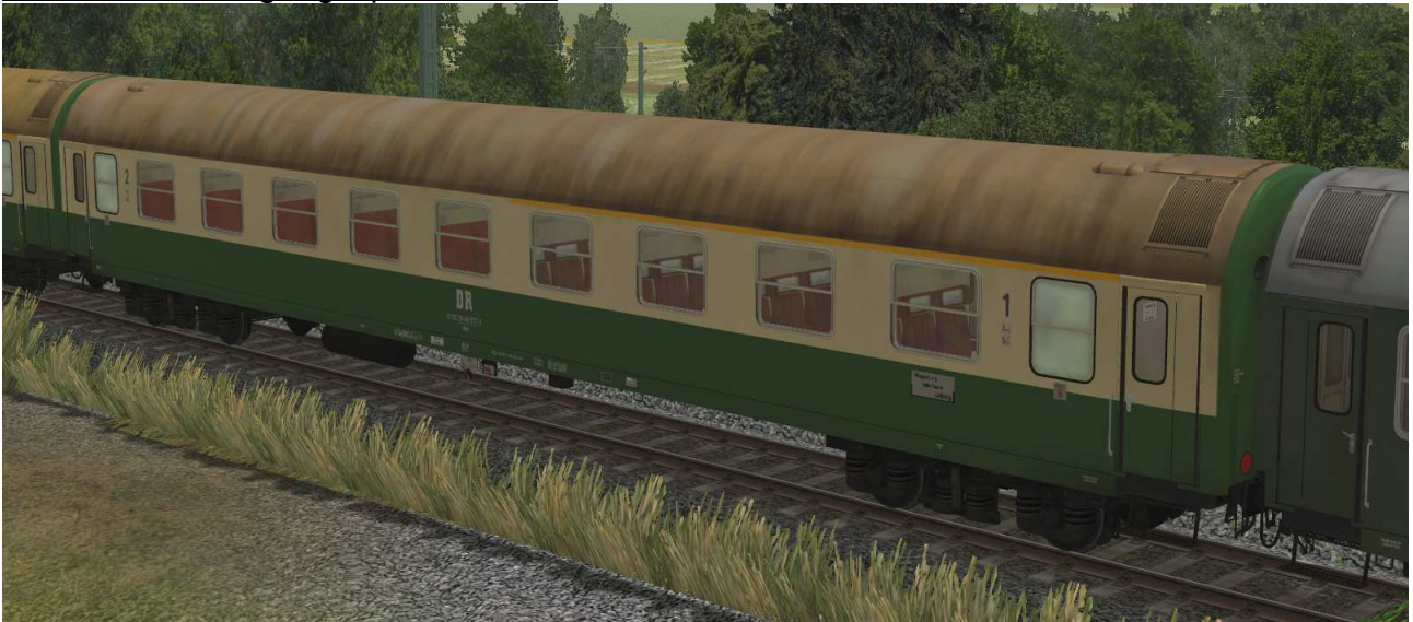
Abteilwagen 1./2.Klasse Typ Y der DR, Gattung ABme3941, grün-beige Lackierung, modernisiert