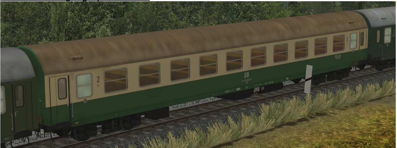
Abteilwagen 2.Klasse Typ YB70 der DR, Gattung Bme2080, grün-beige Lackierung