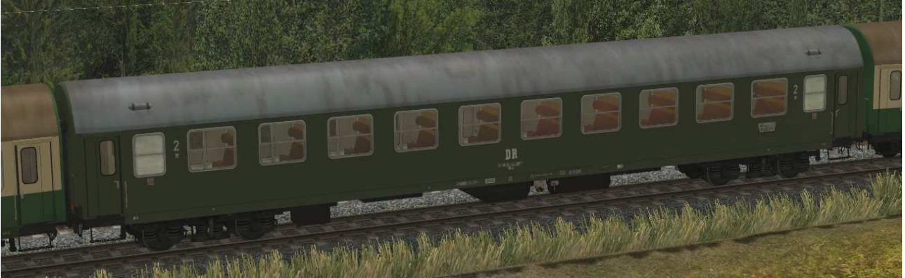
Abteilwagen 2.Klasse Typ YB70 der DR, Gattung Bme2080, grüne Lackierung - EpIV