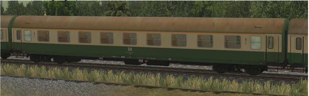
Abteilwagen 1.Klasse Typ YB70 der DR, Gattung Ame1942, grün-beige Lackierung, ehemaliger Städteexpresswagen