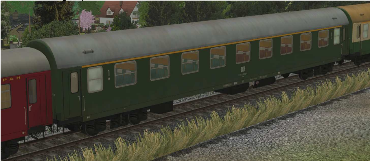
Abteilwagen 1.Klasse Typ YB70 der DR, Gattung Ame1980, grüne Lackierung - EpIV