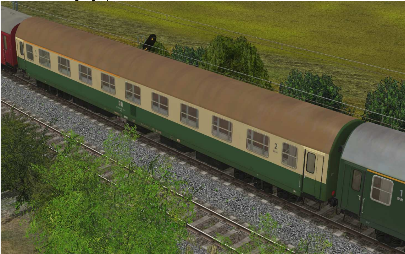
Abteilwagen 1./2.Klasse Typ YB70 der DR, Gattung ABme3980, grün-beige Lackierung