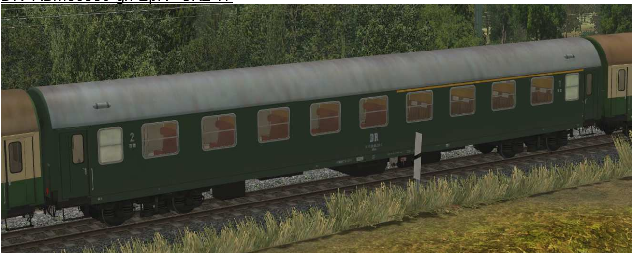
Abteilwagen 1./2.Klasse Typ YB70 der DR, Gattung ABme3980, grüne Lackierung - EpIV