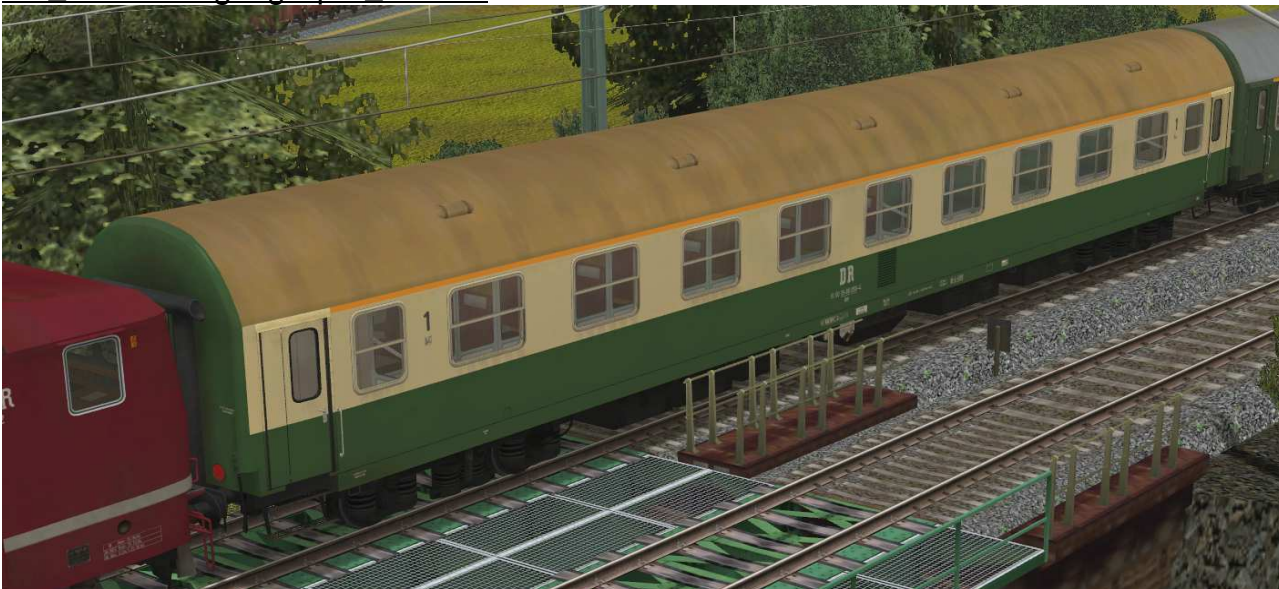
Abteilwagen 1.Klasse Typ YB70 der DR, Gattung Ame1980, grün-beige Lackierung