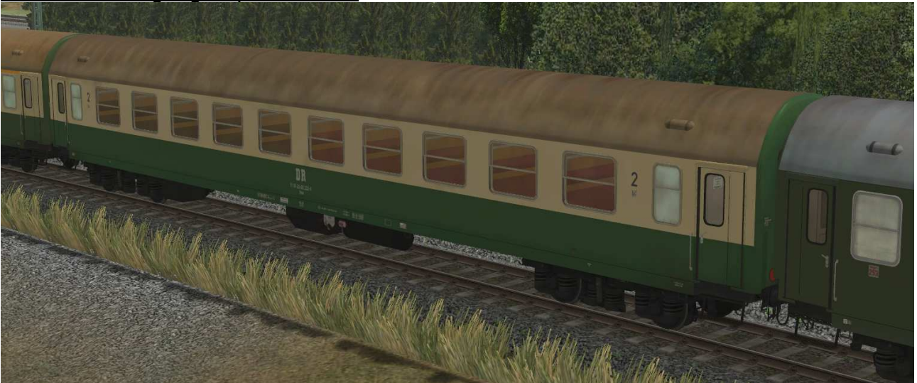
Abteilwagen 2.Klasse Typ YB70 der DR, Gattung Bme2080, grün-beige Lackierung