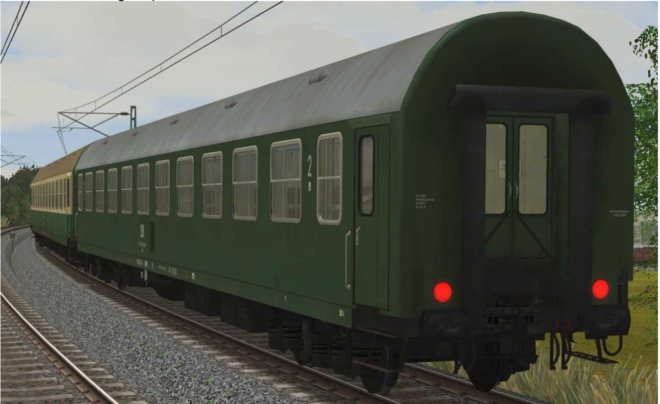
Liegewagen Typ YB70 der DR, Gattung Bcme5941, grüne Lackierung