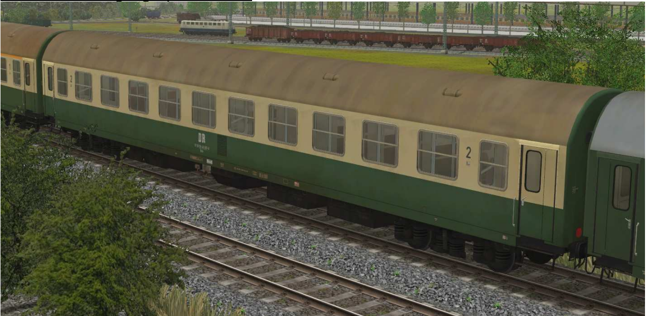
Liegewagen Typ YB70 der DR, Gattung Bcme5941, grün-beige Lackierung