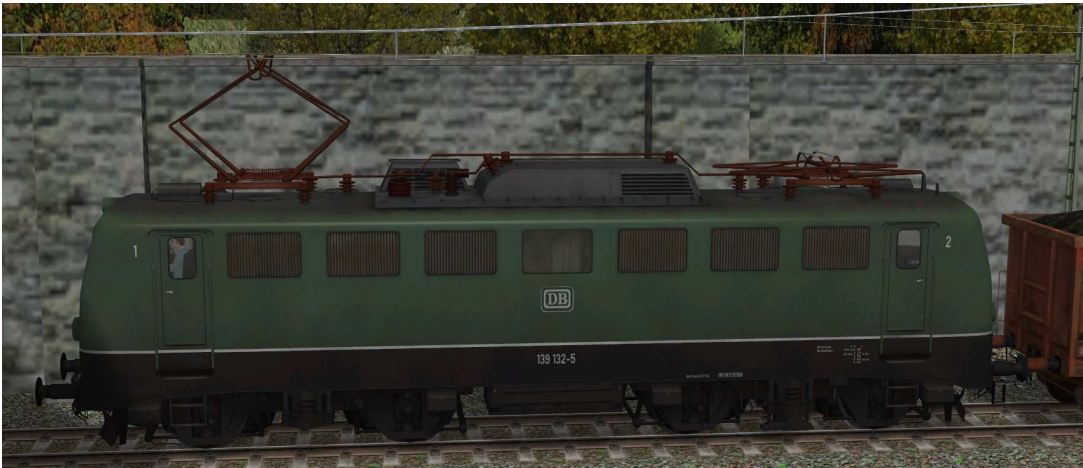
Stromabnehmer: Stromabnehmer 1 angehoben, Stromabnehmer 2 gesenkt

Die beweglichen Stromabnehmer können manuell oder über Kontaktpunkt angehoben und abgesenkt werden.