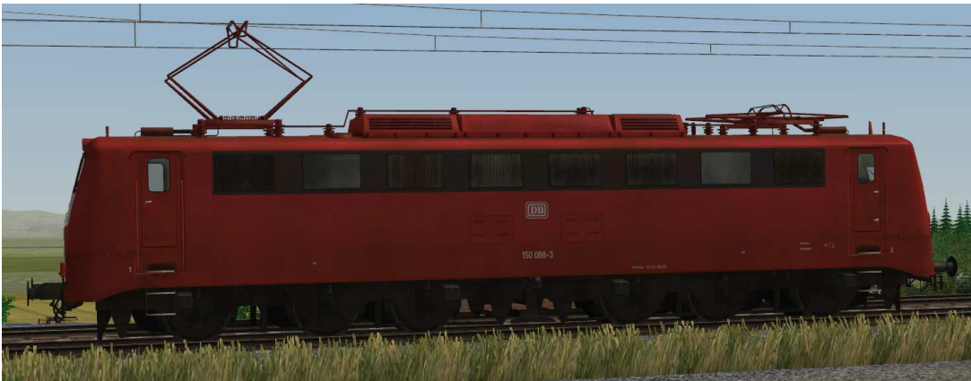
Stromabnehmer: Stromabnehmer 1 angehoben, Stromabnehmer 2 gesenkt

Die Achsenbezeichnungen lauten „Stromabnehmer1-150-088“ für den vorderen und „Stromabnehmer2-150-088“ für den hinteren Stromabnehmer.