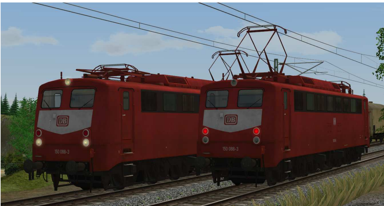
Beleuchtung: 2-Licht-Zugschluß- (rechts) und 3-Licht-Spitzensignal (links)

Die Beleuchtung wechselt fahrtrichtungsabhängig von Dreilichtspitzensignal auf 2-Licht-Zugschlußsignal. Auf der gekuppelten Seite ist das Licht ausgeschaltet.