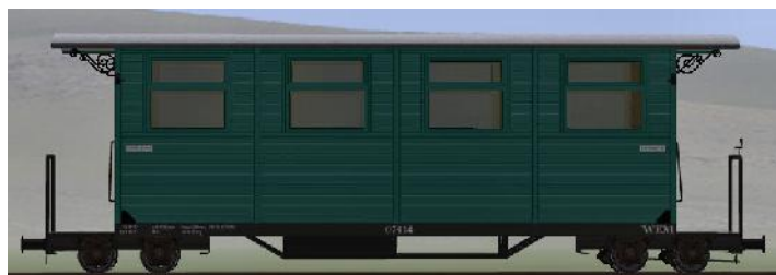
GWP 22 Bj 1995/98 – 07-114n – Wagen mit Unterflurheizung (Modellname: WEM_Personenwagen_07_114n – enthalten in: V70NKK10014)