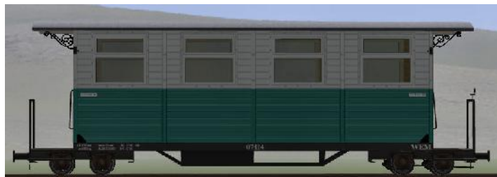
GWP 22 Bj 1995 – 07-114 – Wagen mit Unterflurheizung (Modellname: WEM_Personenwagen_07_114 – enthalten in: V70NKK10014)