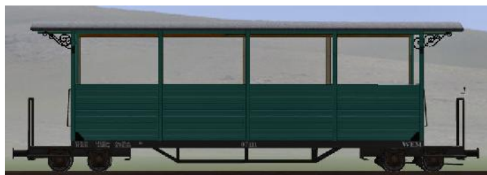
GWP 22 Bj 1995/98 – 07-111n – halboffener Wagen (Modellname: WEM_Personenwagen_07_111n – enthalten in: V70NKK10014)