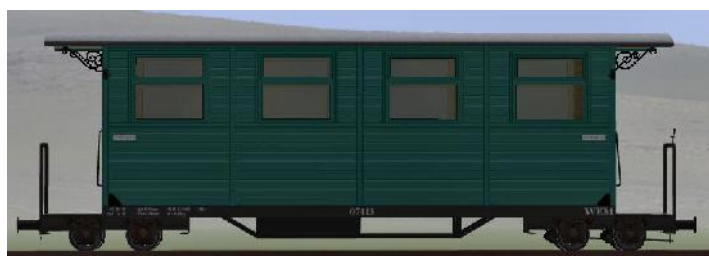
GWP 22 Bj 1995/98 – 07-113n – Wagen mit Unterflurheizung (Modellname: WEM_Personenwagen_07_113n – enthalten in: V70NKK10014)