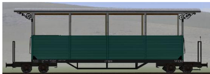
GPW 22 Bj 1995 – 07-108 – halboffener Wagen (Modellname: WEM_Personenwagen_07_108 – enthalten in: V70NKK10014)