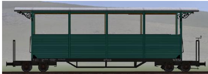
GWP 22 Bj 1995/98 – 07-110n – halboffener Wagen (Modellname: WEM_Personenwagen_07_110n – enthalten in: V70NKK10014)