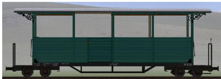
GPW 22 Bj 1995/98 – 07-107n – halboffener Wagen mit Traglastenabteil (Modellname: WEM_Personenwagen_07_107n – enthalten in: V70NKK10014)