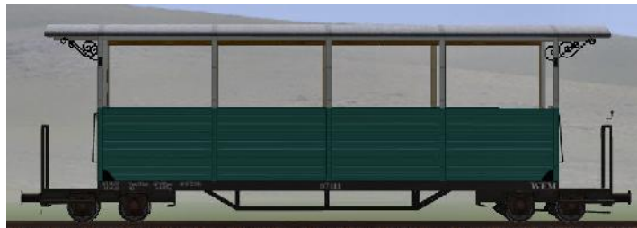
GWP 22 Bj 1995 – 07-111 – halboffener Wagen (Modellname: WEM_Personenwagen_07_111 – enthalten in: V70NKK10014)