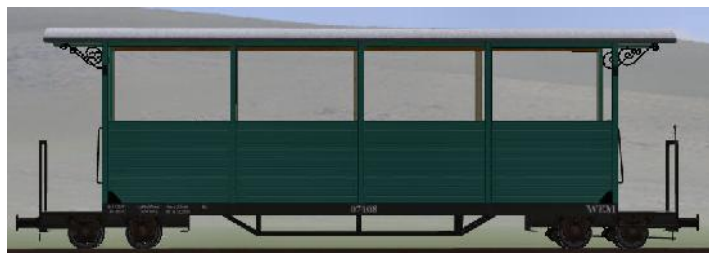
GPW 22 Bj 1995/98 – 07-108n – halboffener Wagen (Modellname: WEM_Personenwagen_07_108n – enthalten in: V70NKK10014)