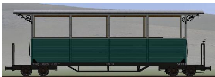
GPW 22 Bj 1995 – 07-109 – halboffener Wagen (Modellname: WEM_Personenwagen_07_109 – enthalten in: V70NKK10014)