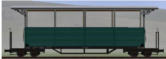
GWP 22 Bj 1995 – 07-112 – halboffener Wagen mit zwei gebremsten Drehgestellen (Modellname: WEM_Personenwagen_07_112 – enthalten in: V70NKK10014)