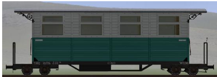
GWP 22 Bj 1995 – 07-113 – Wagen mit Unterflurheizung (Modellname: WEM_Personenwagen_07_113 – enthalten in: V70NKK10014)