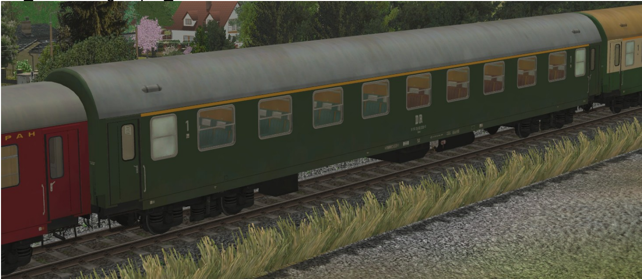
Abteilwagen 1.Klasse Typ YB70 der DR, Gattung Ame1980, grüne Lackierung - EpIV