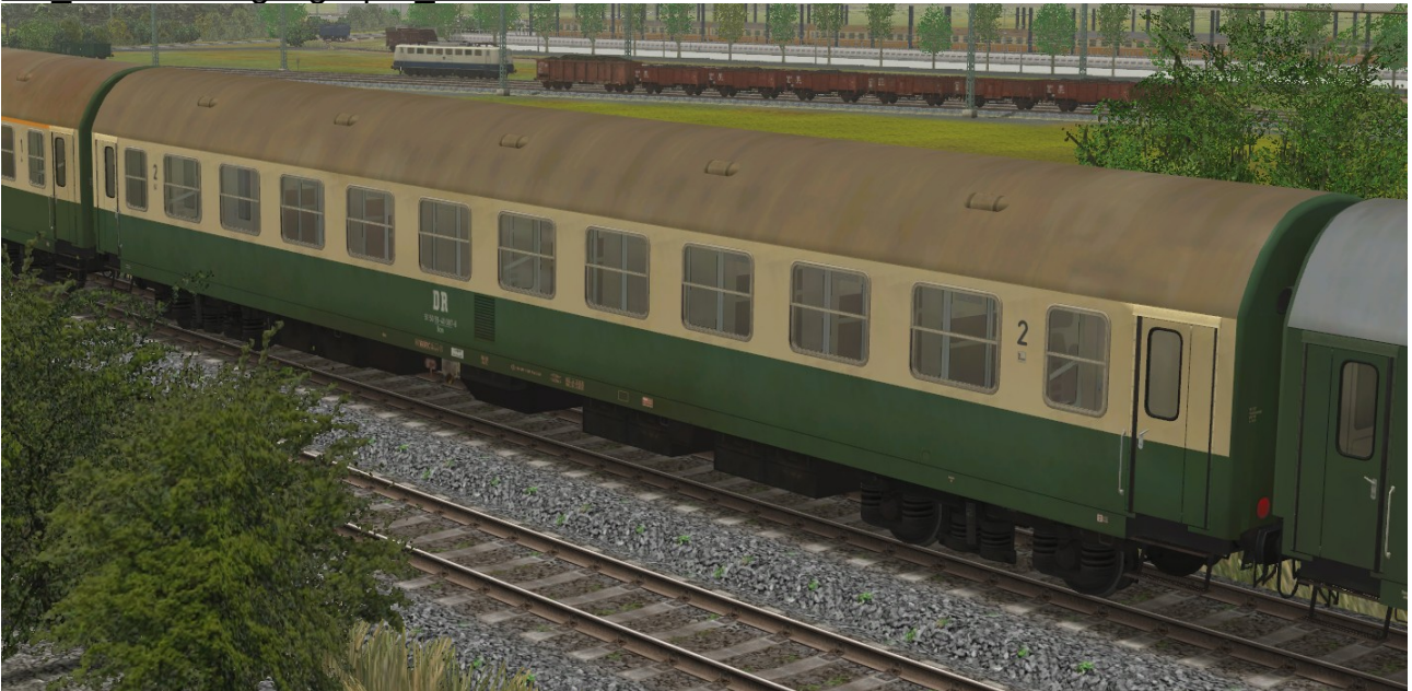
Liegewagen Typ YB70 der DR, Gattung Bcme5941, grün-beige Lackierung