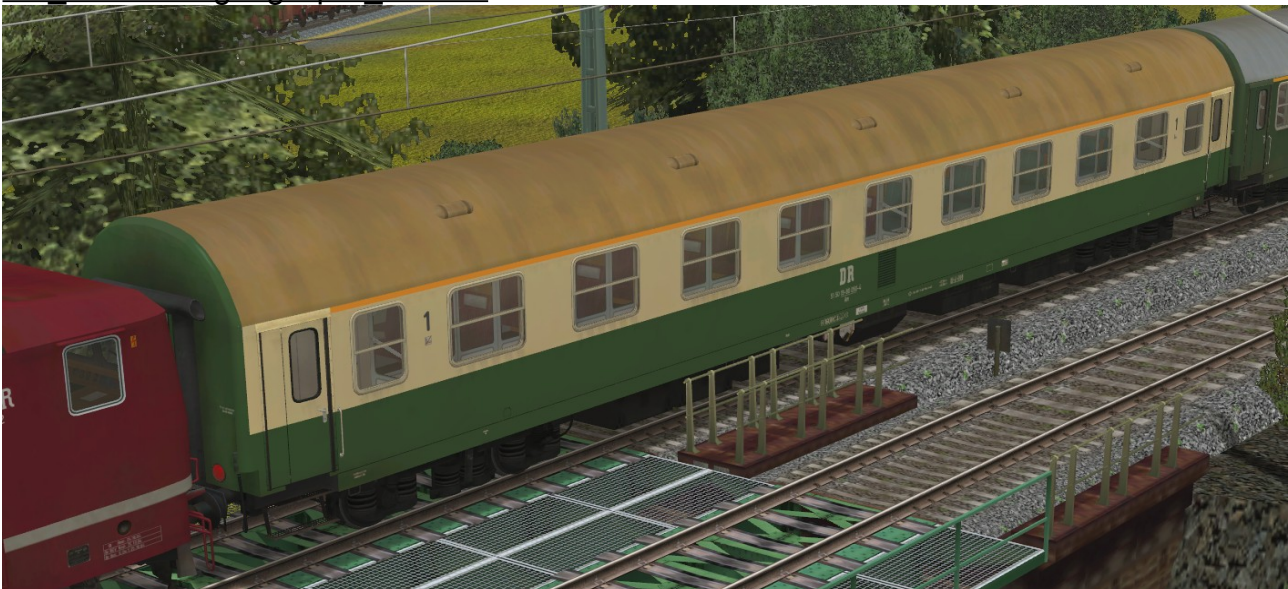
Abteilwagen 1.Klasse Typ YB70 der DR, Gattung Ame1980, grün-beige Lackierung