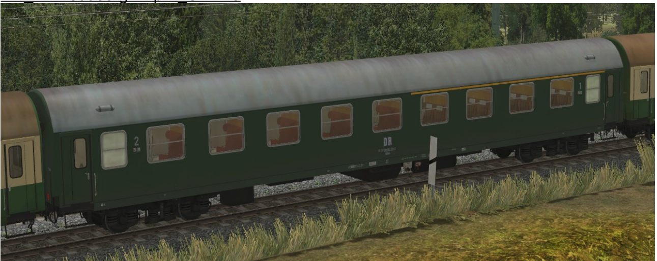
Abteilwagen 1./2.Klasse Typ YB70 der DR, Gattung ABme3980, grüne Lackierung - EpIV