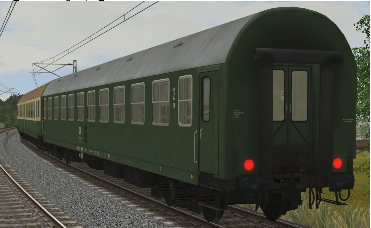
Liegewagen Typ YB70 der DR, Gattung Bcme5941, grüne Lackierung