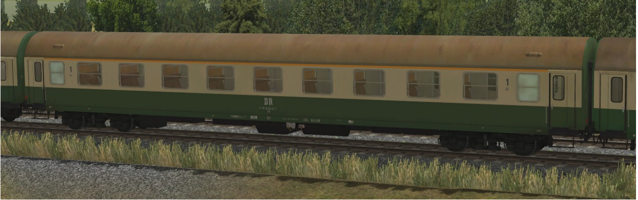
Abteilwagen 1.Klasse Typ YB70 der DR, Gattung Ame1942, grün-beige Lackierung, ehemaliger Städteexpresswagen