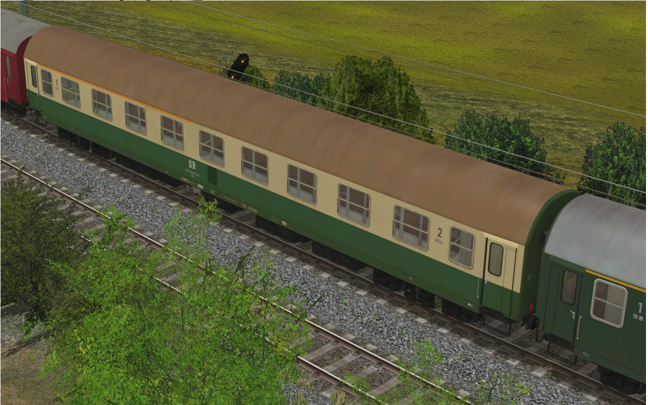
Abteilwagen 1./2.Klasse Typ YB70 der DR, Gattung ABme3980, grün-beige Lackierung