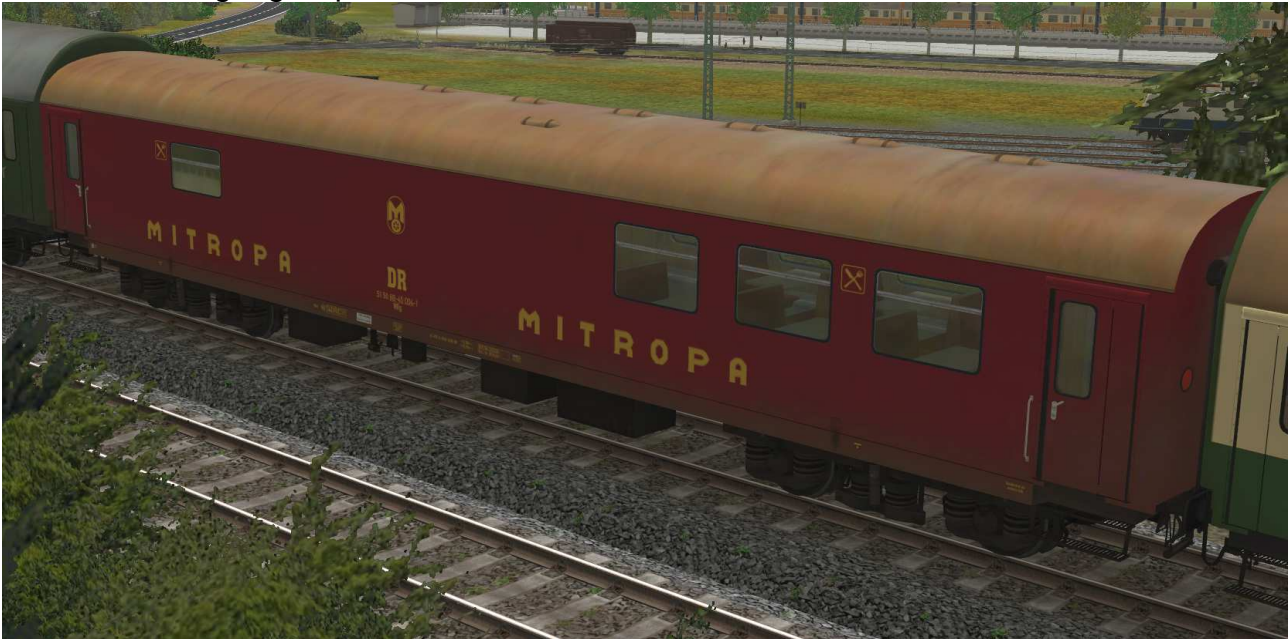
Reko-Speisewagen der DR, Gattung WRge2556 – erste Lieferserie, Ausführung EpIVb