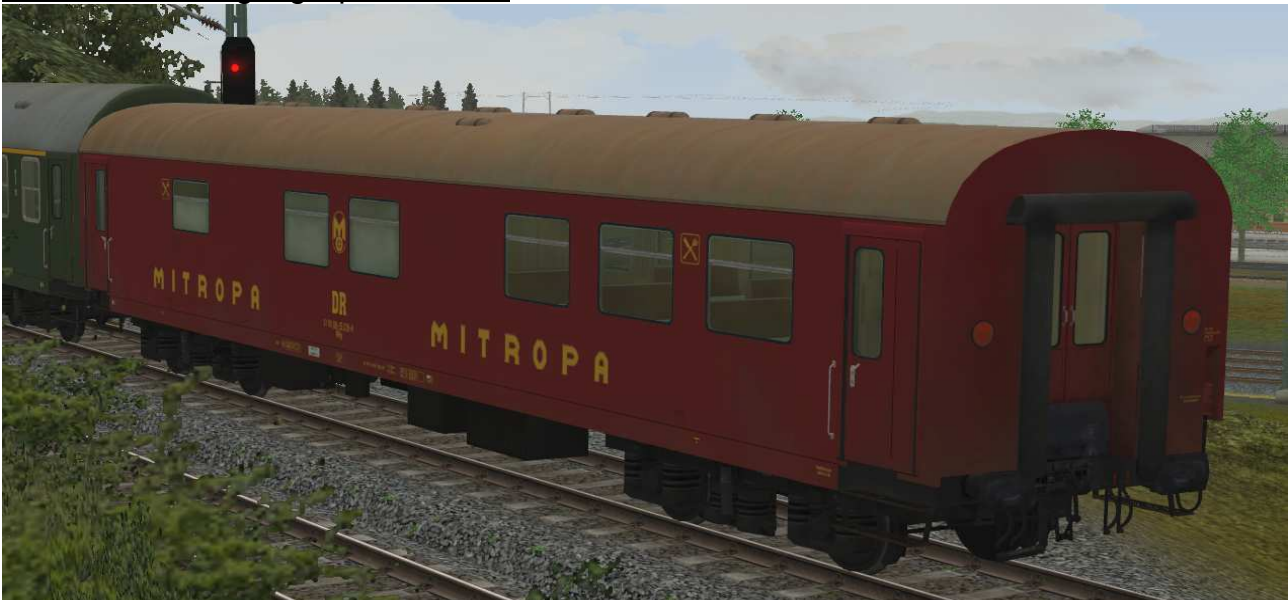
Reko-Speisewagen der DR, Gattung WRge2556 – zweite Lieferserie, Ausführung EpIVb