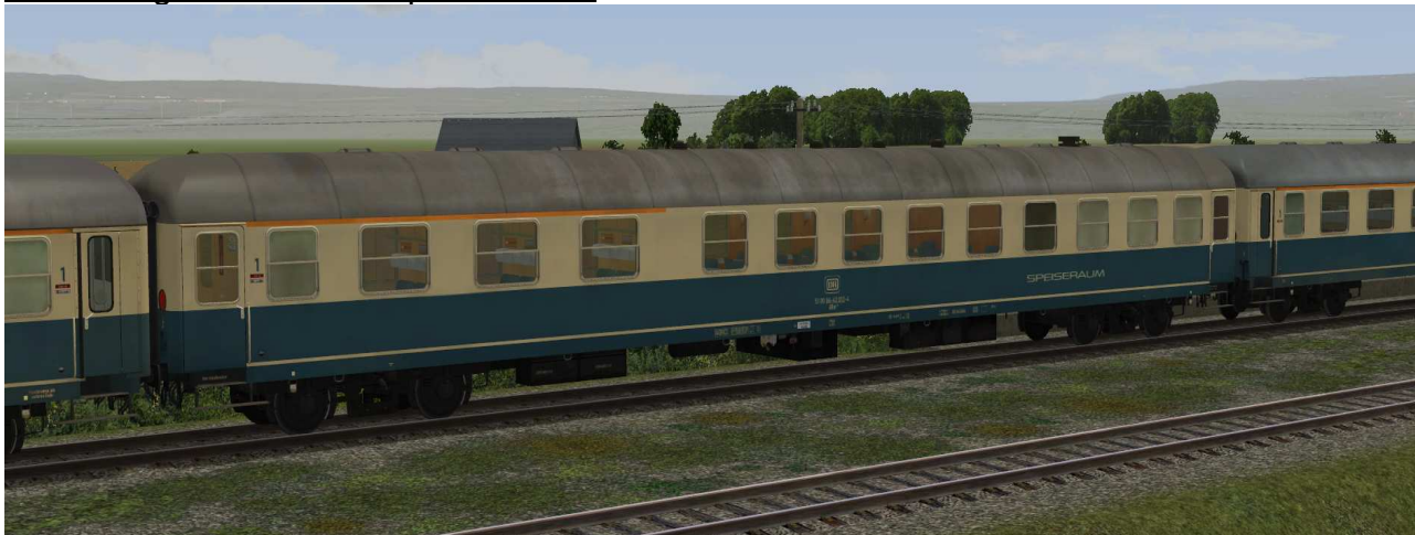
DB D-Zug-ARm216-bb-EpIV SK2-v8

Halbspeisewagen der Gattung Arm216 in EpIV mit Klapptüren und Anschrift Speiseraum in DSG Ausführung sowie Raucher-/Nichtraucher Anschriften