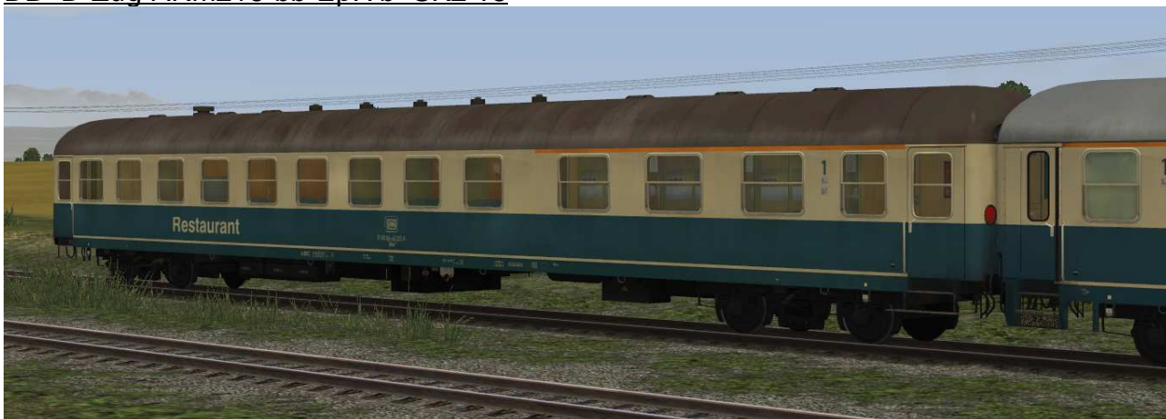
DB D-Zug-ARm216-bb-EpIVb SK2-v8

Halbspeisewagen der Gattung Arm216 in EpIVb mit Klapptüren und Anschrift Speiseraum in großer DB-Ausführung sowie Raucher-/Nichtraucher Piktogramme