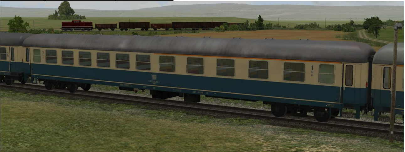
DB D-Zug-ABm225-bb-EpIVb SK2-v8

Sitzwagen 1./2.Klasse der Gattung ABm225 in EpIVb mit Drehfalttüren, Klapptrittstufen und großen Abteilfenstern im Bereich der 2. Klasse, Raucher-/Nichtraucher-Piktogramme