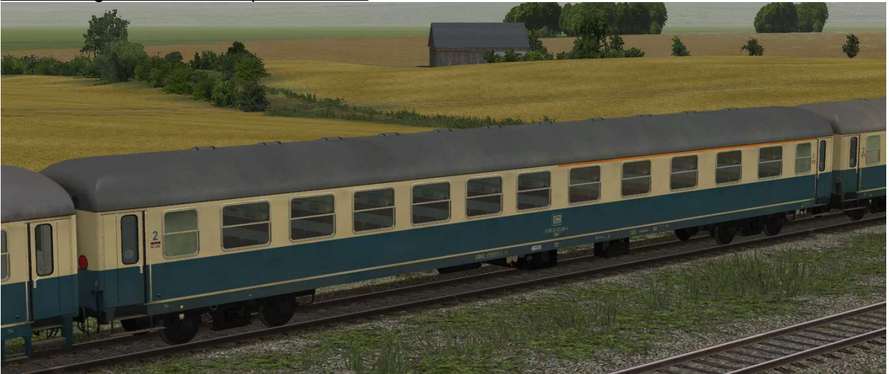
DB D-Zug-ABm225-bb-EpIV SK2-v8

Sitzwagen 1./2.Klasse der Gattung ABm225 in EpIV mit Drehfalttüren, festen Trittstufen und großen Abteilfenstern im Bereich der 2. Klasse, Raucher-/Nichtraucher-Anschriften