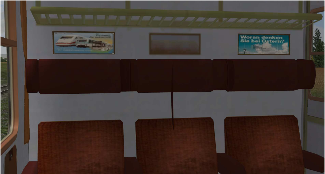
Sitzbereich 2. Klasse

Bei ausgewähltem Rollmaterial (Taste F9) kann mit Drücken der Taste 8 auf der Tastatur in die Innenansicht umgeschaltet werden.