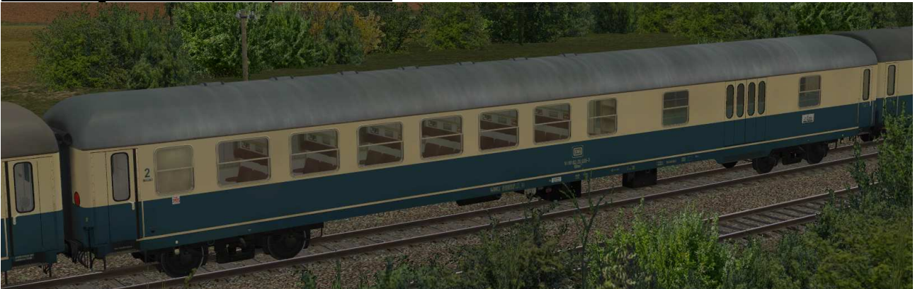
DB D-Zug-BDms273-bb-EpIV SK2-v8

Halbgepäckwagen mit Sitzbereich 2.Klasse der Gattung BDms273 in EpIV mit Drehfalttüren, festen Trittstufen und großen Abteifenstern, Raucher-/Nichtraucher-Anschriften