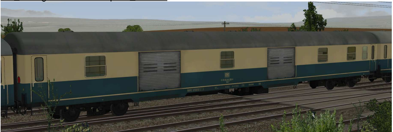
Gepäckwagen der Gattung Dms905 in EpIVb mit verzinkten Rolltoren