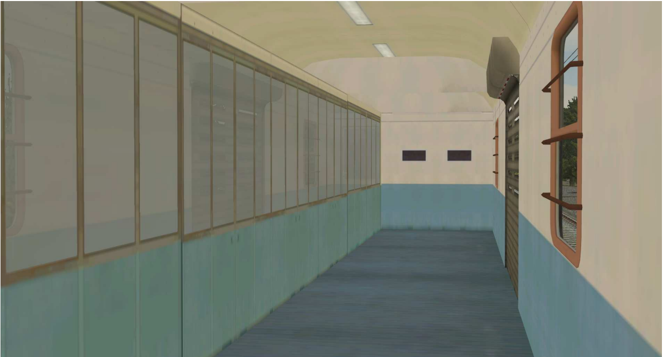
Gepäckwagen - Laderaum