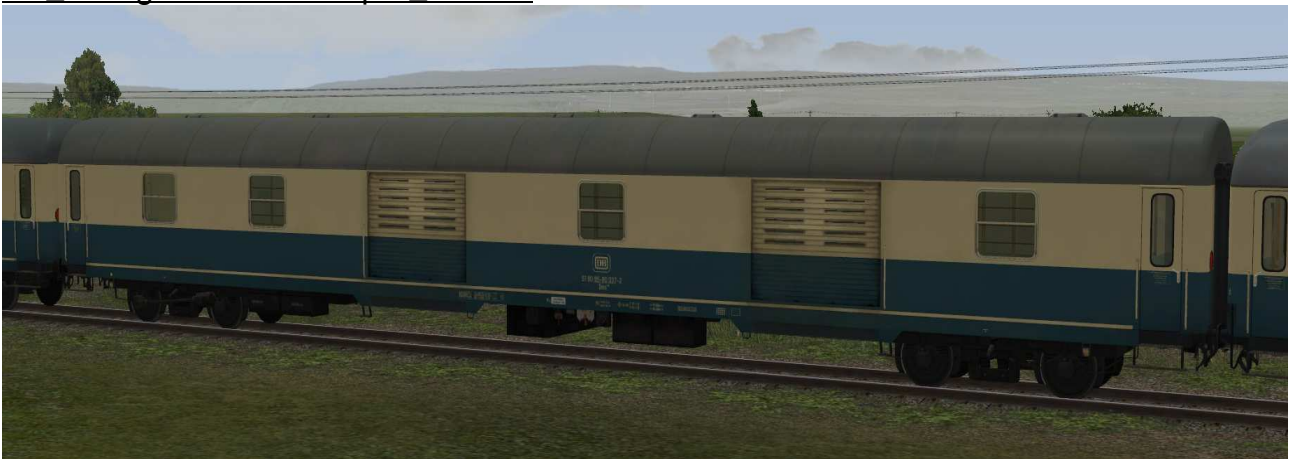
Gepäckwagen der Gattung Dms905 in EpIV