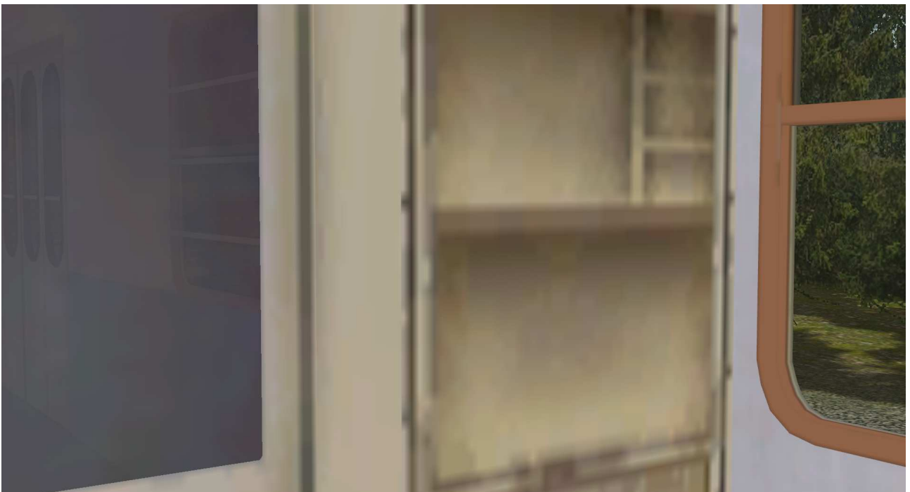
Gepäckwagen - Dienstabteil