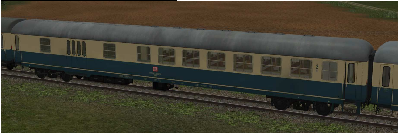
DB D-Zug-BDms273-bb-EpIVb SK2-v8

Halbgepäckwagen mit Sitzbereich 2.Klasse der Gattung BDms273 in EpIVb mit Drehfalttüren, Klapptrittstufen und großen Abteifenstern, Raucher-/Nichtraucher-Piktogrammen