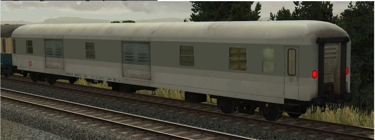
Gepäckwagen der Gattung Dms 902, Einsatz im Fernverkehr