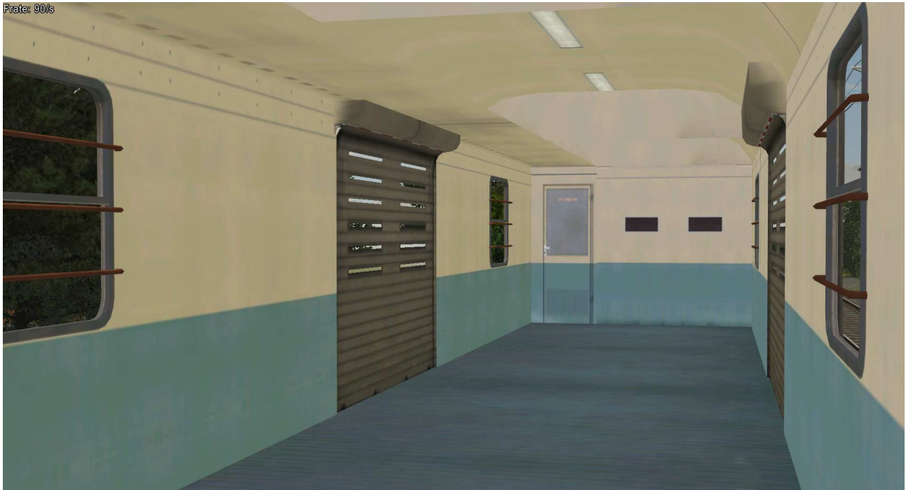
Gepäckwagen ohne Seitengang

Bei ausgewähltem Rollmaterial (Taste F9) kann mit Drücken der Taste 8 auf der Tastatur in die Innenansicht umgeschaltet werden.