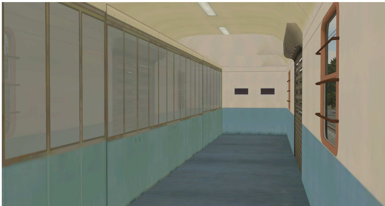
Gepäckwagen - Laderaum