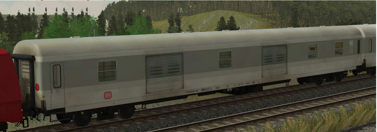
Gepäckwagen der Gattung Dms 905, Einsatz im Fernverkehr