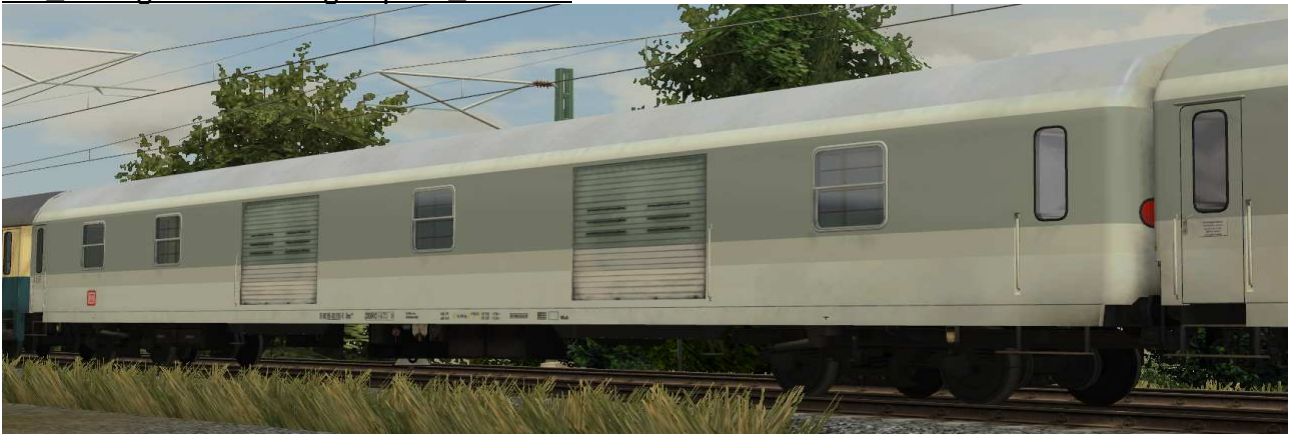
Gepäckwagen der Gattung Dms 905.1 für 200 km/h Höchstgeschwindigkeit, Einsatz im Fernverkehr