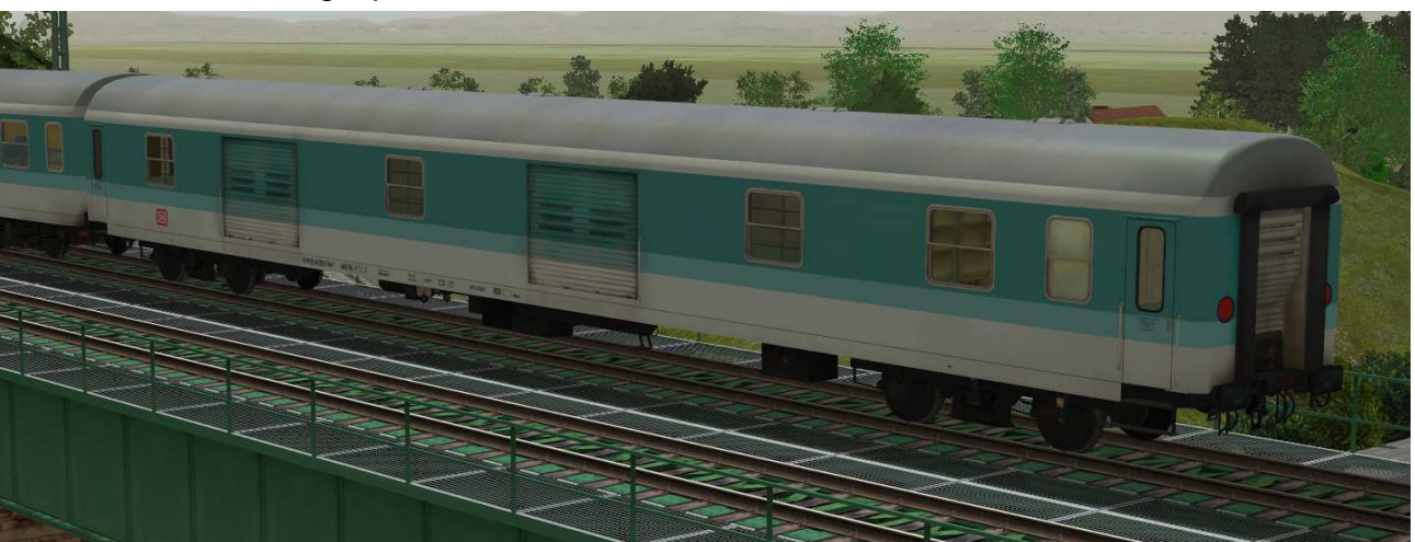
Gepäckwagen der Gattung Dms922, Einsatz im Regionalverkehr