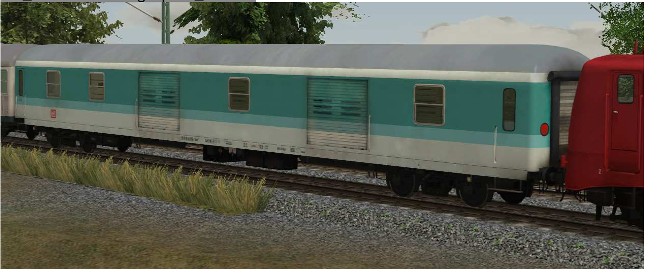
Gepäckwagen der Gattung Dms920, Einsatz im Regionalverkehr