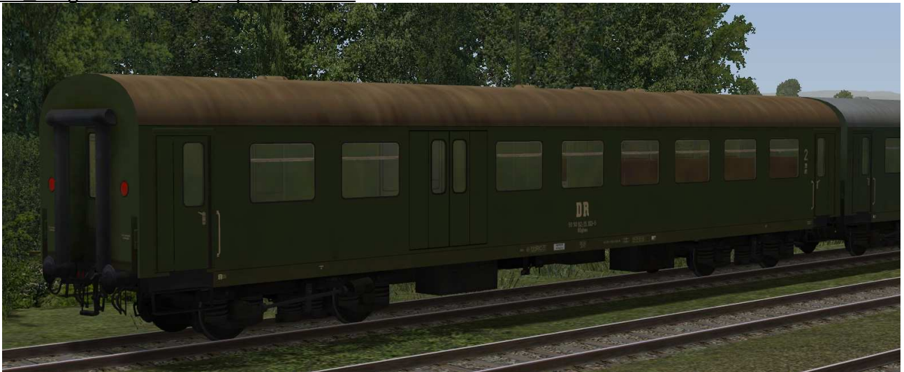
Buffetwagen der Gattung Wrg2556 – Umbau aus Speisewagen der zweiten Bauserie