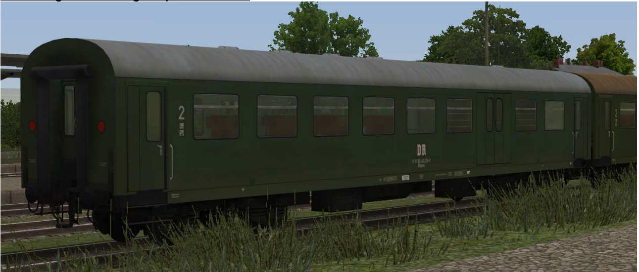
Buffetwagen der Gattung Wgr2556 – Umbau aus Speisewagen der ersten Bauserie